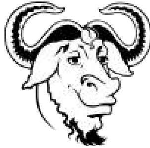
Logo de GNU.