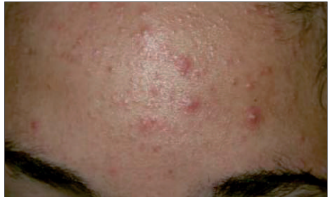
Figura 1. Acné en adolescente.

La evidencia entre el consumo de alimentos con alto contenido en glúcidos y el acné cada vez se afianza más 22 . La hiperinsulinemia aumenta la biodisponibilidad de los andrógenos y las concentraciones de IGF-I, que a su vez, estimulan la producción de sebo y la hiperqueratosis, agravando el acné. Uno de los primeros estudios en esta materia fue el realizado en el 2007 por Smith et al. 23 . Compararon los efectos de una dieta baja en glúcidos con una dieta convencional americana, alta en glúcidos y valoraron los aspectos clínicos y endocrinos del acné. 43 varones con acné siguieron una dieta baja en glúcidos durante 12 semanas. En los primeros resultados, en los pacientes que habían tomado una dieta baja en glúcidos, observaron un descenso en el número de lesiones de acné, así como una pérdida de peso, del índice de andrógenos libres y un aumento de insulin-like growth factor binding proteins-1 (que reduce la biodisponibilidad de la IGF-I). Otros estudios posteriores, entre ellos un ensayo clínico randomizado,