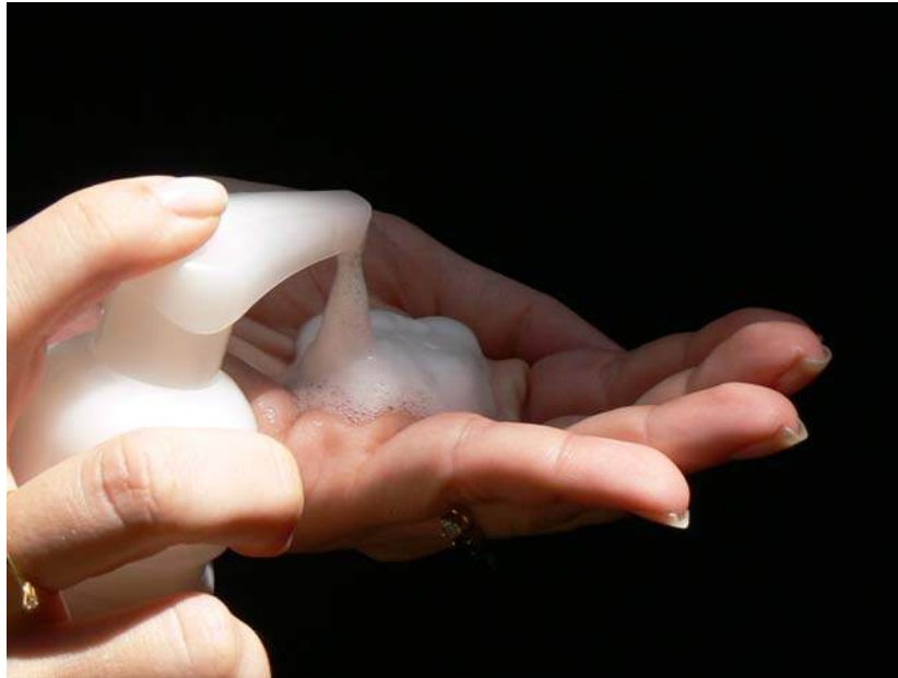
Figura 6: Para algumas aplicações a espuma é indesejada

final. O antiespumante fragiliza e quebra os filmes líquidos encerrando as bolhas de ar que formam a espuma fazendo com que a espuma abaixe e se incorpore à suspensão ou emulsão. Algumas substâncias usadas como antiespumantes são as sílicas micronizadas, óleos vegetais, ácidos graxos de cadeias longas e óleos de silicone.