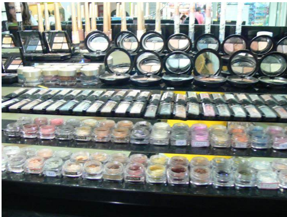
Figura 1: O Brasil é o sexto consumidor mundial de maquiagens e o segundo consumidor mundial de sabonetes per capita (FAO/ONU, 2009)

É muito difícil se fazer uma distinção precisa entre os cosméticos para embelezamento por cobertura pura e simples, como as maquiagens, e aqueles cosméticos destinados ao cuidado pessoal e à obtenção de propriedades específicas, como redução na formação de rugas.