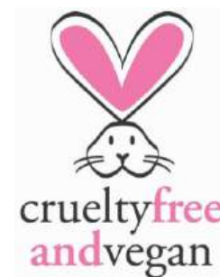
Figura 8: Selos internacionais de certificação de cosméticos livres de testes em animais.

Vários órgãos internacionais que regulam a produção de cosméticos, alimentos e farmacêuticos disponibilizam para acesso público um vasto banco de dados para a grande maioria dos ingredientes de cosméticos. Esse banco de dados contém as informações mais importantes sobre cada substância aplicada para diversos organismos vivos, incluindo o homem. Estão listados dados como doses máximas de ingestão, de exposição cutânea ou de inalação, dose letal, antídotos em caso de overdoses e outras informações importantes ligadas à toxicidade das substâncias. Normalmente também estão disponíveis nesse banco de dados informações com respeito à ecotoxicidade desses compostos e as consequências para o meio ambiente (ar, água doce, oceanos e solo), em caso de um derramamento ou vazamento dessas substâncias, além do tempo que as mesmas levarão para ser totalmente biodegradadas pela natureza.