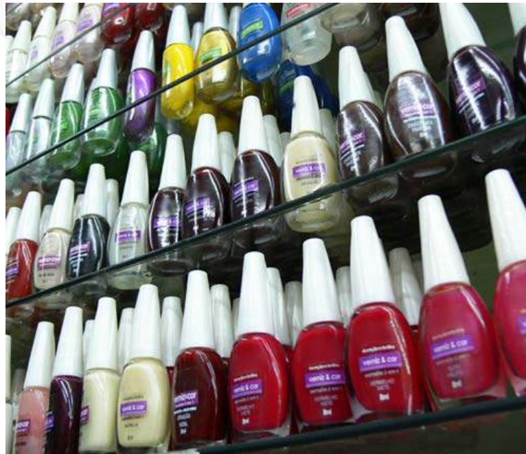
Figura 5: Esmaltes são exemplos de cosméticos muito dependentes de pigmentos e corantes