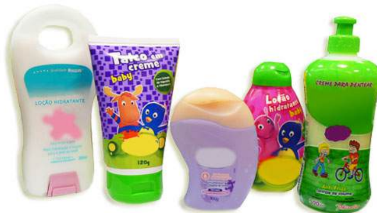
Figura 2: Produtos para bebês são especialmente formulados e comercializados em embalagens diferenciadas.

• Risco nível 1 → Risco mínimo. Ex.: maquiagem (pós compactos, bases líquidas, sombras, rímel, delineadores, batons em pasta e líquidos), perfumes, sabonetes, xampus, cremes de barbear, pastas dentais, cremes hidratantes, géis para fixação de cabelos, talcos perfumados, sais de banho, etc.