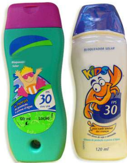
Figura 4: Desde jovem faça do sol o seu amigo

privilegiando a ação dos raios UV-A (que ocorrem no início e no final do dia) e a proteção da pele com protetores solares e bloqueadores anti-UV deve ser feita desde a mais tenra idade.