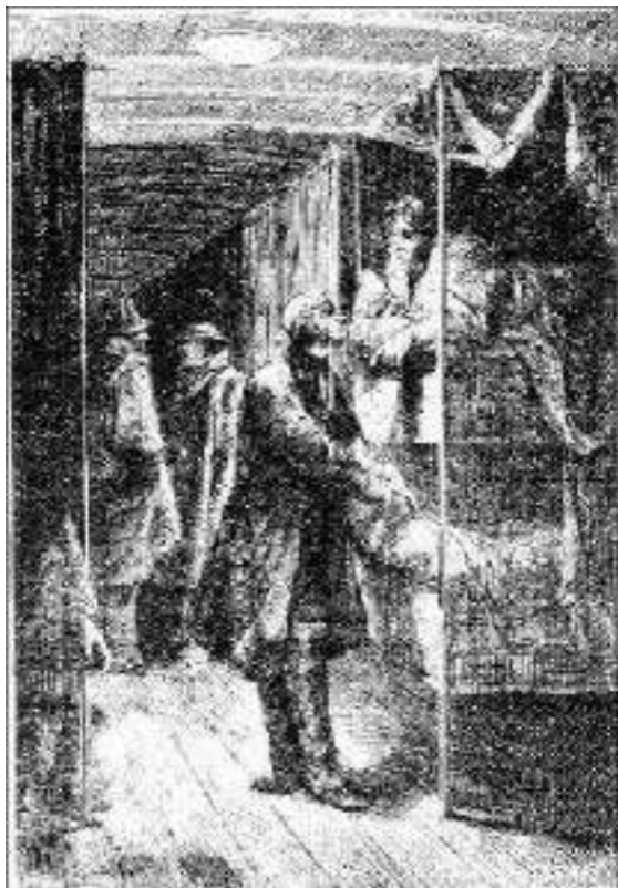
os lençóis eram brancos...