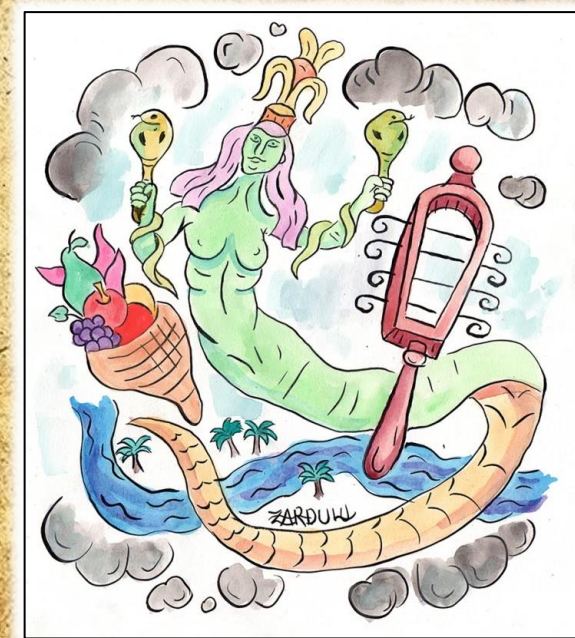
Култ кон божицата Изида