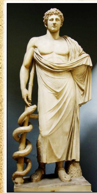
Култ кон богот Асклепиј