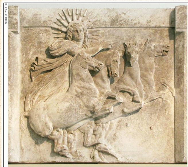
Култ кон непобедливото сонце (Sol Invictus)