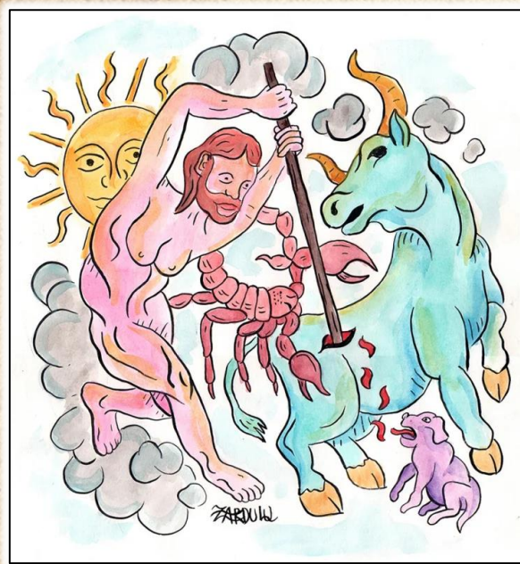
Култ кон богот Митра