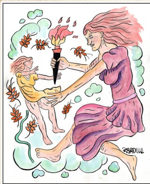
Култ кон божицата Деметра и нејзината ќерка Персефона