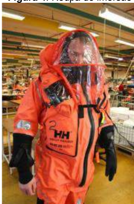
Figura 4: Roupa de imersão

A roupa de imersão não deve permitir a entrada de água, no caso de lançamento a água de uma altura não inferior a 4,5 metros e deve garantir proteção térmica suficiente, durante uma hora, em águas de correntes calmas e com temperatura de 5 graus Celsius, não causando ao utilizador, descidas de temperatura superiores a 2 graus Celsius se usados com roupas quentes e mesmo saltando de uma altura não inferior a 4,5 metros. Essa roupa pode ser utilizada como colete salva-vidas também, desde que satisfaçam as disposições a estes aplicáveis possuindo sinal luminoso e apito ligado por fiel. Após ter permanecido na água durante uma hora, a roupa de imersão deverá permitir ao utilizador que, com as mãos cobertas, possa escrever com lápis.