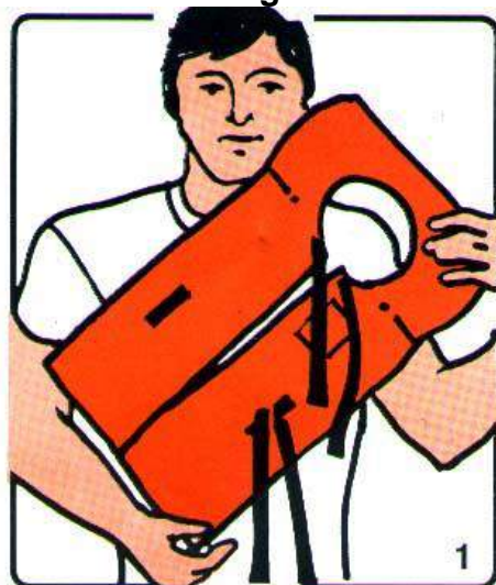
Figura 3: Como colocar o colete salva-vidas

Desamarre os cintos, superior e inferior, livrando completamente este último do passador direito do salva-vidas.