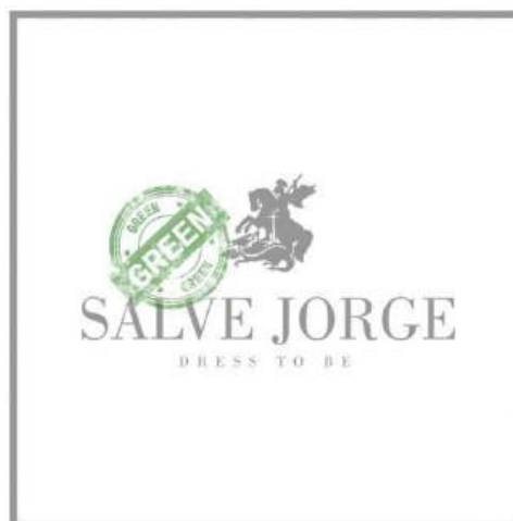
Figura 5 - Logotipo Salve Jorge Green