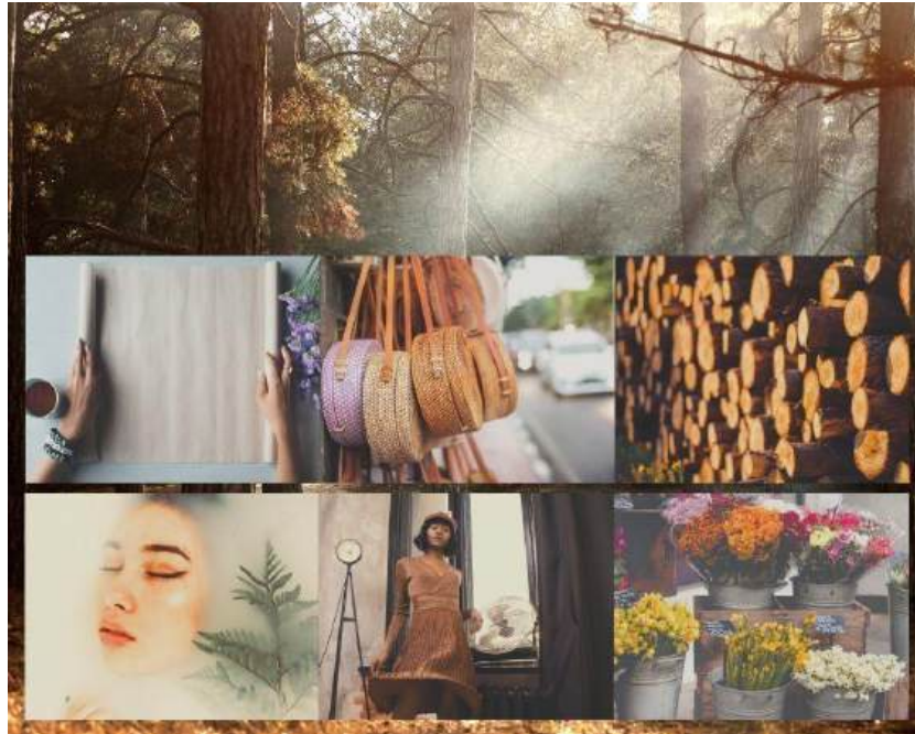
Figura 7 - Painel Conceitual Temática de Inspiração da Coleção

As modelagens amplas e referem-se a liberdade que a natureza nos remete, apresentando mistura de tecidos, texturas e materiais alternativos, que representam as possíveis e variadas soluções para a construção de uma moda ética e sustentável.