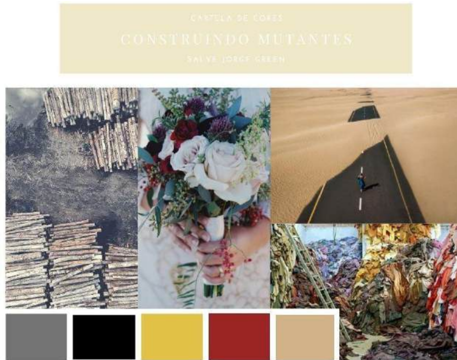
Figura 8 - Painel Conceitual Cartela de Cores