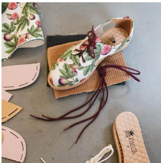
Figura 1 - Sapatos desenvolvidos pela marca Insecta