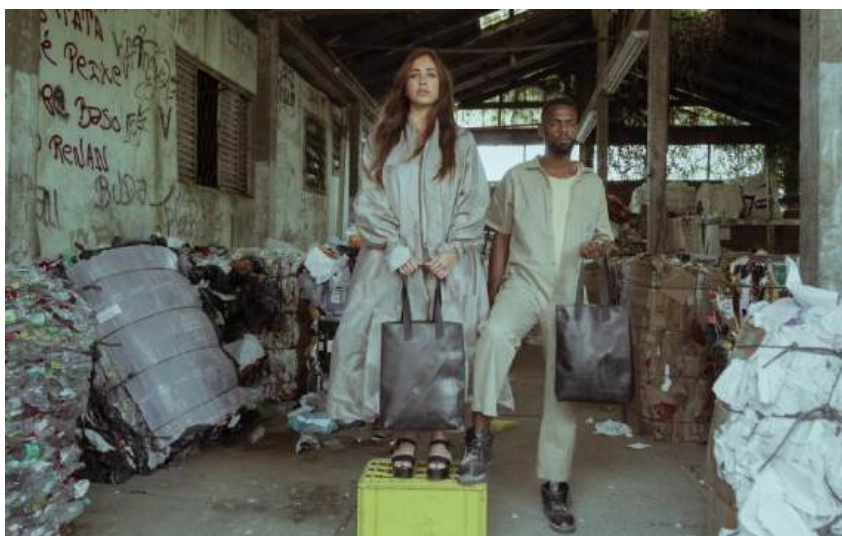
Figura 2 - editorial de moda no Campo da Tuca - usina de triagem de lixo seco

Segundo a plataforma digital Revoada (2013) a coleta e compra de resíduos como câmaras de pneus, é comprada direto dos borracheiros nas borracharias. Também fazem parcerias com fabricantes de câmaras, reutilizando o que não passa no seu controle de qualidade e seria descartado. Já os tecidos de guarda-chuva são comprados direto dos catadores de lixo nas Unidades de Triagem de Lixo Seco. Além da compra, os catadores são incentivados a vender as hastes dos guarda-chuvas para reciclagem de metal. A higienização dos resíduos é realizada em uma lavanderia industrial que possui captação de água da chuva e tratamento correto da água, tudo com certificação. A produção é feita em pequenos ateliês de costura e em cooperativas de costureiras. A Revoada, conforme consta em seu próprio site, faz seus produtos para que sejam duráveis. Os clientes são instruídos para que ao final da vida útil do produto, entrem em contato com a Revoada, assim, a empresa cuida da logística reversa e reaproveitamento os materiais como novas matérias primas, reinicia o ciclo novamente.