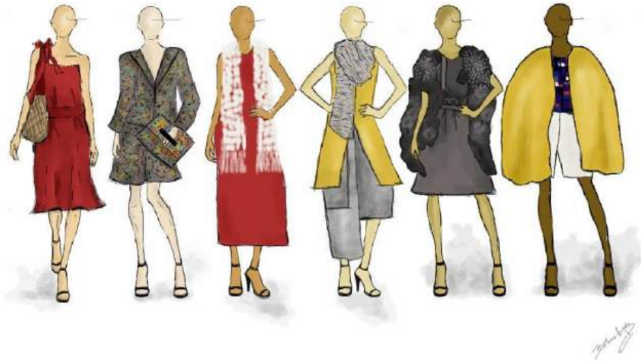
Figura 9 - Painel Desenvolvimento de Coleção