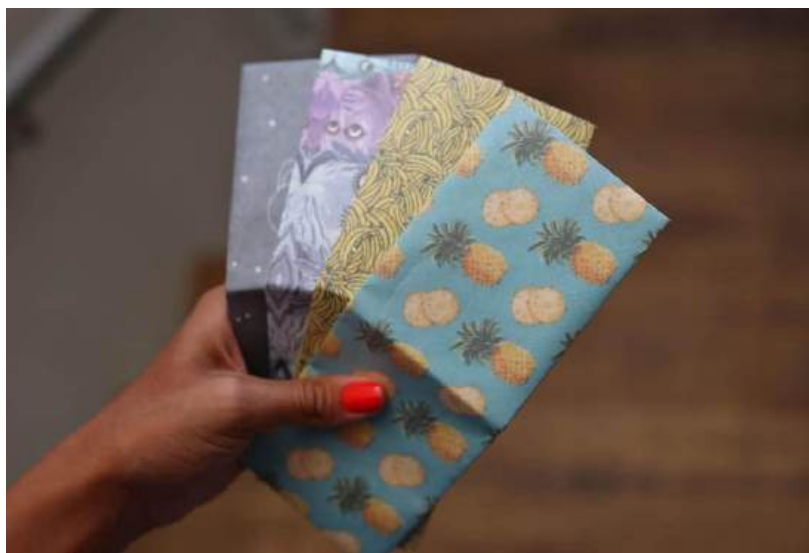
Figura 3 - Imagem que mostra as estampas feitas por artistas

Outra empresa com proposta de moda renovada, que também é gaúcha. Muito irreverente, busca através de seus produtos, ferramentas para que se consiga atingir coisas muito maiores. Suas embalagens se transformam em outros utensílios evitando resíduos, seus cartões são todos biodegradáveis podendo ser plantados posteriormente. As estampas dos produtos são produzidas por artistas locais Brasileiros, além de o salário de todos os funcionários e fundadores ser igualitário. (BOBRA 2013)