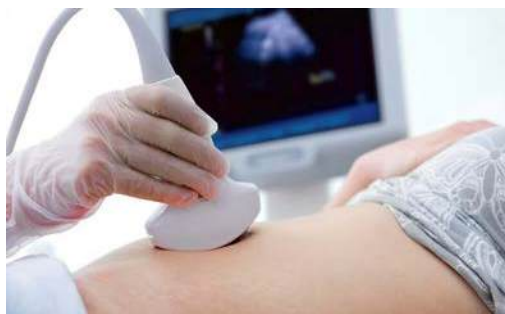
Figura 5. Ecografía

Alejandra Guerrero. 5 cosas que debes saber antes de hacerte una ecografía