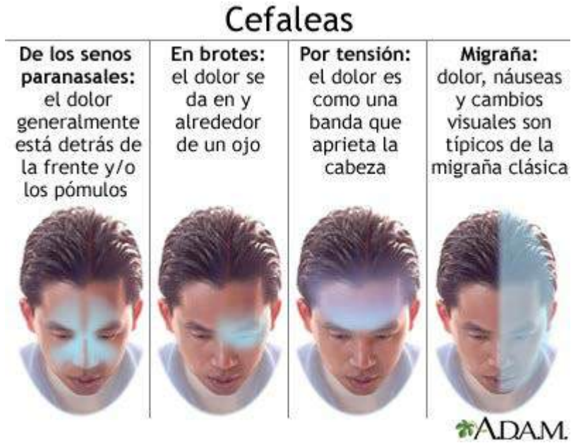
Figura 8. Cefaleas

Enciclopedia médica Medline. Cefalea tensio- nal [Internet]. 2020 [citado 15/10/2020]. Disponible en: https://medline-plus.gov/spanish/ency/article/000797.htm