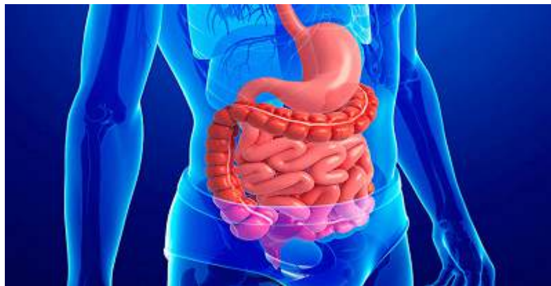
Figura 10. Enfermedades gastrointestinales

Notimex. Desarrollan sensor que puede detectar enfermedades gastrointestinales [Internet]. 2018 [citado 15/10/2020]. Disponible en: https://www.portalpolitico.tv/salud/desarrollan-sensor-que-puede-detectar-enfermedades-gastrointestinales