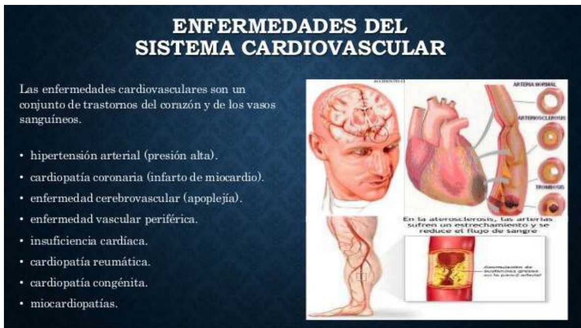
Figura 6. Enfermedades del sistema cardiovascular

Michelle Cruz Rosales. Exploración clínica del sistema cardiovascular [Internet]. 2016 [citado 15/10/2020]. Disponible en: https://www.slideshare.net/michellevolkov3/exploracin-clnica-del-sistema-cardiovascular