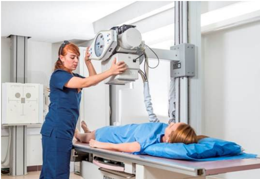
Figura 2. Rayos X

Helitac. Rayos X [Internet]. 2016 [citado 14/10/2020]. Disponible en: http://www.grupohelitac.com/service/rayos-x/