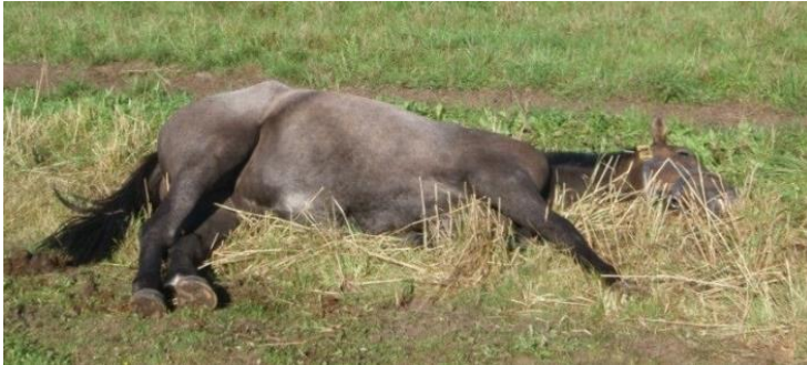
Foto 8. Los caballos necesitan tumbarse lateralmente para llegar a un sueño profundo. La posición natural es de extender las patas, el cuello y la cabeza.