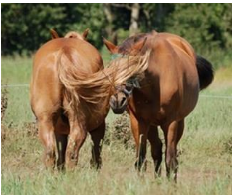
Foto 7. Dos caballos permanecen juntos para ahuyentar a los insectos de sus cabezas.

Aunque los caballos son animales sociales, tienen un espacio social que define la distancia que desean conservar a otros caballos. Esta distancia es individual y depende de la edad y del grado de reconocimiento entre ellos. Durante el aseo social, por ejemplo, la distancia es cero. También pueden verse juntos al intentar mantener alejados a los insectos. Los potros y caballos jóvenes parecen tener un espacio social muy estrecho o menos desarrollado, por lo que pueden verse tendidos todos juntos. Cuando los caballos son alojados en grupos, es importante tener en cuenta el espacio social a la hora de decidir cuánto espacio se les debe proporcionar.