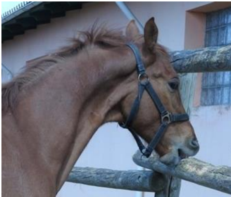
Foto 9. La aerofagia puede tener lugar en cualquier superficie adecuada

Otros comportamientos anómalos pueden ser comportamientos normales que se producen con una frecuencia anormal, como una conducta agresiva. El desarrollo de comportamientos anómalos difiere entre individuos. Es un malentendido el pensar que los estereotipos son contagiosos. Si los caballos de un mismo establo desarrollan el mismo comportamiento anómalo, lo más probable es que refleje que se mantienen bajo las mismas condiciones subóptimas. Además, los caballos en relación pueden compartir la misma sensibilidad al estrés.