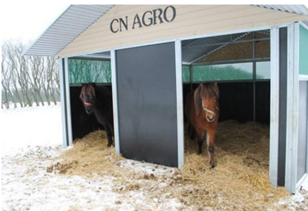
Foto 15. El cobertizo debe ser lo suficientemente grande como para ofrecer protección a todos los caballos al mismo tiempo.

El entorno natural, como los árboles, setos u otra vegetación natural, así como los cobertizos construidos, pueden proporcionar un abrigo suficiente.