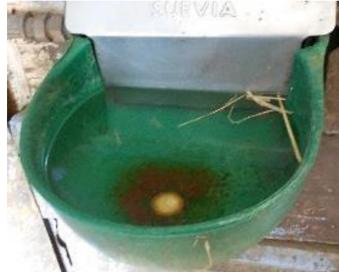
Foto 20. Debe controlarse diariamente la limpieza y funcionalidad de los bebederos.

Los bebederos deben mantenerse limpios, y colocarse de manera que se reduzca al mínimo la contaminación. En el alojamiento colectivo o en los paddocks y en los pastos debe haber suficiente espacio para beber, a fin de evitar competitividad y agresividad entre los caballos.