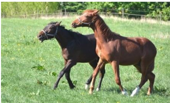
Foto 10. El contacto social es importante para los caballos.

Como se ha mencionado anteriormente, los caballos son animales gregarios, y la falta de contacto social con otros caballos, tanto desde una edad temprana como posteriormente, puede provocar el desarrollo de comportamientos anómalos diferentes y la falta de desarrollo del comportamiento social normal. Los caballos prefieren un contacto físico directo completo en pastaderos, en pastos o en alojamientos colectivos.