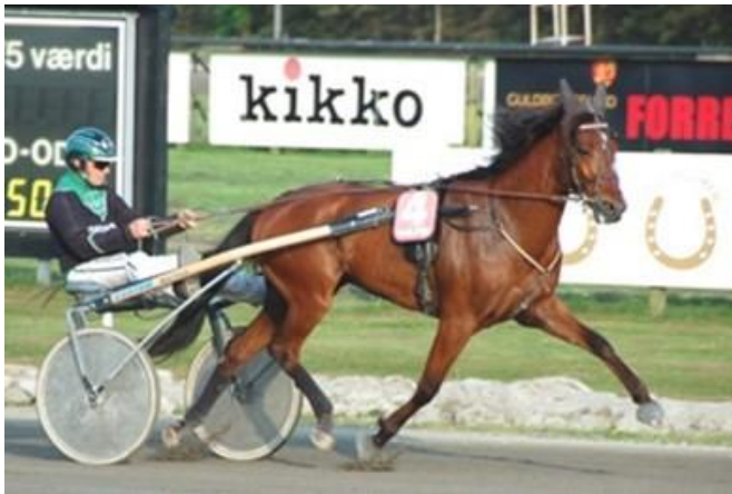
Foto 18. Algunos tipos de équidos pueden necesitar complementar su dieta con piensos de alta energía.

Todas las fuentes de alimento deben ser de buena calidad higiénica y nutricional y almacenarse en condiciones higiénicas. No debe alimentarse con pienso pulverulento, enmohecido o enranciado.