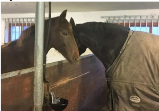
Foto 12. Boxes individuales que permiten a los caballos contactar entre sí.

Los boxes individuales (con el animal suelto) deben estar dimensionados a fin de adecuarse al tamaño del caballo, de modo que el caballo pueda acostarse en una posición lateral natural (véase la foto 8), darse la vuelta, levantarse sin trabas y permanecer en una posición natural. Los boxes de parto o los boxes de yegua con rastra deben ser más grandes que las de un único caballo. Al considerar las necesidades de espacio, debe tenerse en cuenta el tiempo que pasa el caballo en el box. El box debe ser más grande si el caballo está estabulado la mayor parte del día. La parte superior de los separadores entre los boxes no debe ser compacta, sino permitir que los caballos de los boxes vecinos puedan verse mutuamente y permitan una ventilación adecuada. Los accesorios, tales como los equipos de alimentación y suministro de agua, deben estar situados, diseñados y mantenidos de manera que se eviten lesiones al caballo y, en la medida de lo posible, se evite la contaminación con la orina y las heces.