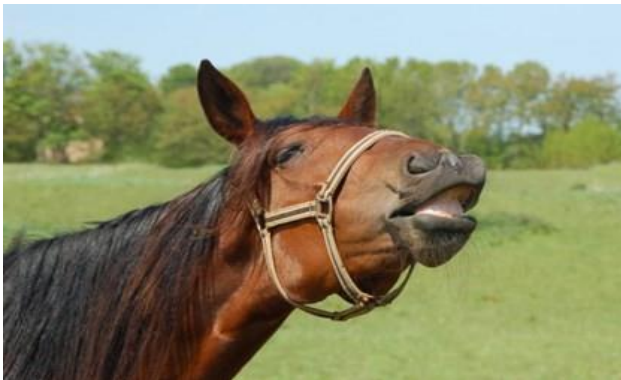
Foto 3. El reflejo de Flehmen permite al caballo investigar un aroma a más distancia

Los caballos son animales gregarios o de rebaño. En condiciones naturales, los caballos viven juntos en grupos estables. Los grupos suelen estar formados por uno o, a veces más de uno, semental adulto y una serie de yeguas con rastra, incluidos machos jóvenes. Los sementales jóvenes y los de más edad que no forman parte de un grupo de yeguas también se agrupan. El grupo se estabiliza a través de un orden social, que es cuestionado por la introducción de nuevos miembros. Un nuevo orden social se suele formar en el periodo de unos pocos días a semanas. Vivir en grupos estables presenta una serie de ventajas, principalmente en relación con la transmisión de comportamientos sociales, la búsqueda de alimentos y agua, y una estrategia de defensa para evitar o reducir al mínimo los encuentros con depredadores. Por ejemplo, todos los caballos de un grupo rara vez descansarán juntos, puesto que uno se quedará en pie y guardará al grupo. Los caballos sentirán, por lo general, ansiedad e inseguridad cuando están aislados de otros caballos. En los caballos domésticos, la falta de contacto social tanto a edad temprana como posterior puede provocar el desarrollo de comportamientos anormales en la trama social en caballos estabulados o interacciones más agresivas cuando se encuentran en pastos con otros caballos. Todavía más, los caballos jóvenes alojados en grupo son más fáciles de manejar y entrenar que los mantenidos individualmente.