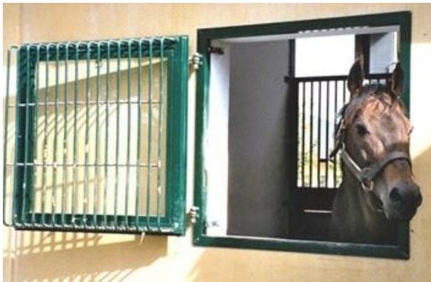
Foto 11. Ventana con rejilla.

Las ventanas de los alojamientos para caballos deben estar hechas de vidrio irrompible o estar protegidas por una rejilla construida adecuadamente o por medios similares para evitar que los caballos rompan el vidrio y se hieran a sí mismos.