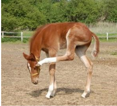
Foto 5. Rascarse con una pierna.

(normalmente la posterior), el rascado contra un objeto, rodar tumbado sobre la arena, barro, nieve, etc., y el aseo social en el que dos caballos se asean entre sí (normalmente en la cruz o el dorso).