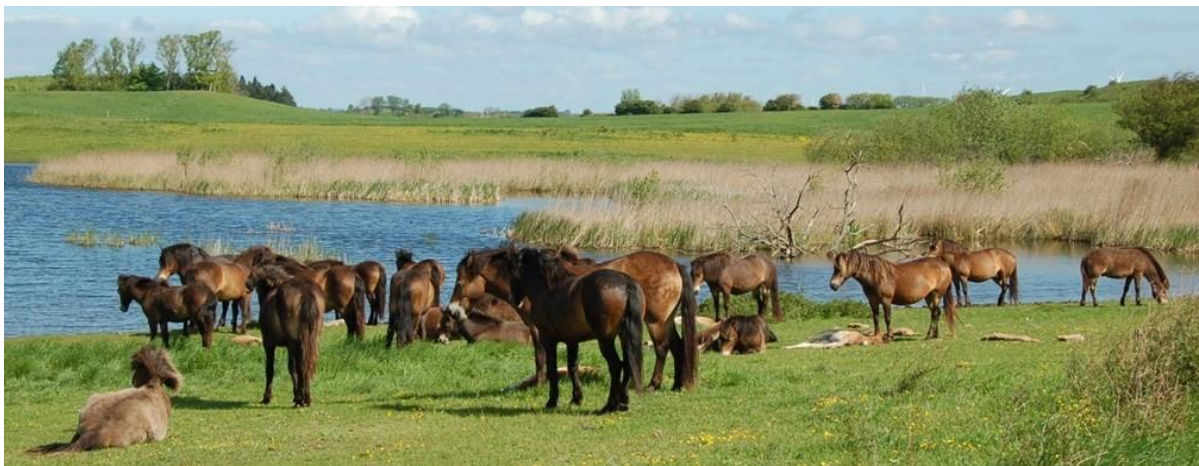
Foto 1. Los conocimientos sobre el comportamiento natural de los caballos proceden principalmente de estudios de caballos salvajes.

El caballo doméstico de hoy, el caballo de Przewalski y otros caballos salvajes, como el actualmente extinto tarpan, comparten un ancestro común. Los conocimientos sobre el comportamiento natural de los caballos proceden en parte de estudios sobre caballos de Przewalski reintroducidos en su hábitat original, pero principalmente de estudios sobre caballos salvajes y descendientes de caballos que se han evadido, y viven en condiciones naturales o seminaturales, sin o con poca interferencia humana.