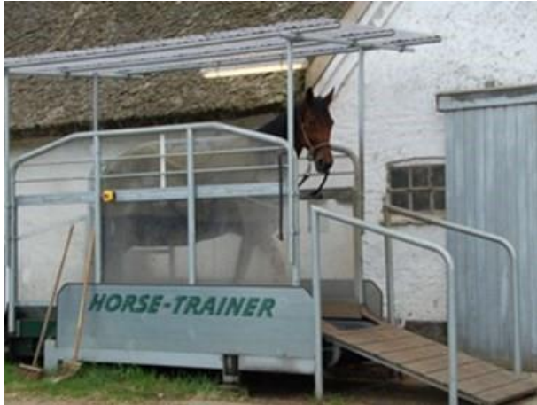
Foto 21. Los caballos deben ser supervisados por una persona competente en todo momento cuando se ejercitan en una cinta rodante.