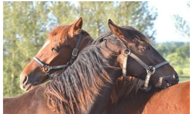
Foto 4. El aseo social es una necesidad prioritaria de los caballos

Los caballos se comunican a través de los sentidos de visión, audición, olfato, postura y tacto. Por ejemplo, los caballos pueden mostrar la respuesta flehmen a la hora de investigar los olores y sabores de especial interés. El tacto puede ser tanto agresivo (pataleadas y mordiscos) como amistoso (aseo social). Algunos de estos comportamientos son innatos, mientras que otros necesitan cierto aprendizaje a una edad temprana. Los caballos jóvenes que se han mantenido aislados tienen dificultades para relacionarse con otros caballos si se introducen en un grupo en una fase posterior.