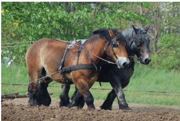
Foto 23. Caballos de trabajo utilizados con fines agrícolas.

Como ocurre con cualquier otro caballo, sus necesidades básicas deben satisfacerse y considerarse la capacidad de carga de trabajo. Les remitimos al capítulo 7.12 sobre el bienestar de los équidos de trabajo del Código Sanitario para los Animales Terrestres de la OIE si necesitan información detallada sobre las necesidades en materia de bienestar de los caballos de trabajo.