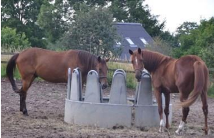
Foto 17. Los caballos deben tener acceso a forrajes, tanto cuando están estabulados como en los paddocks sin hierba.

Una referencia para el suministro diario de forraje en caballos debe ser de al menos 1,2 kg de heno por cada 100 kg de peso vivo o de 2 kg de heno seco por cada 100 kg de peso vivo, aunque puede ser necesario modificarla en caso de aquellos caballos con tendencia a la ganancia de peso o a la infosura.