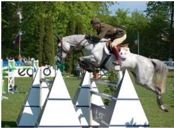
Foto 24. Salto