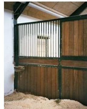
Foto 13. Boxes individuales que permiten verse los caballos entre sí.