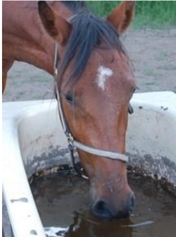
Foto 19. Los caballos prefieren beber a partir de una superficie abierta de agua