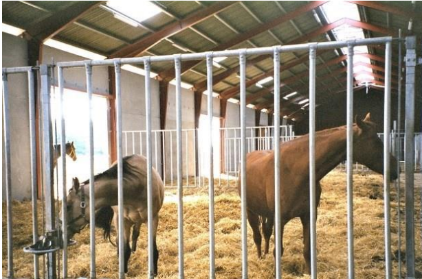
Foto 14. Caballos en un sistema de estabulación en grupo con acceso a un paddock externo.