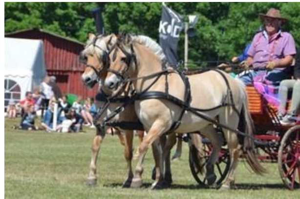
Foto 25. Enganche.

Esto puede incluir normas sobre qué equipos y accesorios pueden utilizarse (por ejemplo, fustas y espuelas), sobre entrenamiento y métodos de corrección durante el calentamiento y la competición, sobre cuando las yeguas preñadas ya no pueden competir o correr, sobre el uso del equipo como medida coercitiva o sobre sustancias o métodos ilegales (dopaje).