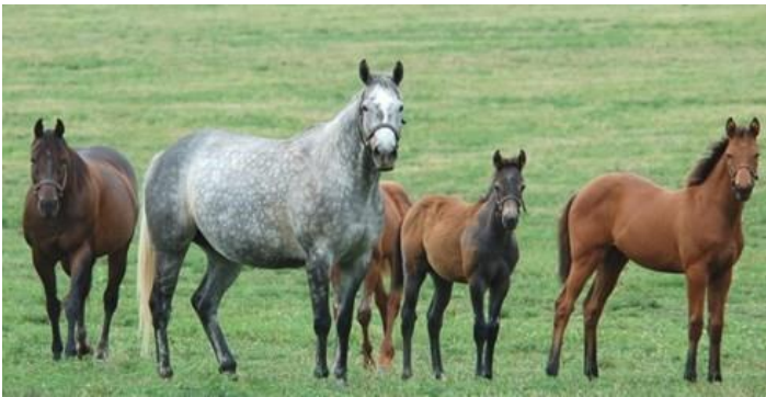
Foto 16. Se recomienda que los caballos tengan acceso diario a un paddock o pasto, en la medida de lo posible con otros caballos.

Se recomienda que todos los caballos tengan acceso diario a paddocks o a pasto, en la medida de lo posible, junto con otros caballos, a fin de satisfacer sus necesidades de libre movimiento y contacto social. Sin embargo, puede haber situaciones en las que por consejo veterinario o por condiciones meteorológicas extremas lo haga contraindicado.