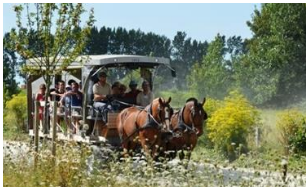
Foto 26. Caballos de carruaje utilizados en turismo.

Los caballos se utilizan de diferentes maneras en relación con el turismo. Puede tratarse de caballo de trekking, incluido el transporte de turistas a lugares de interés, con o sin guía, o como caballos de tiro para conducir turistas en visitas panorámicas, utilización como diferentes tipos de animales de compañía, etc.