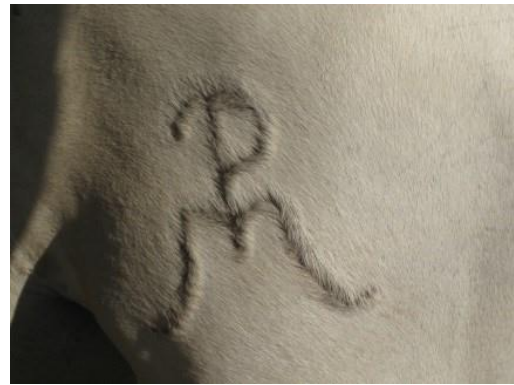
Fotos 27 y 28. El corte de cola y el marcado al fuego deben estar muy desaprobados.