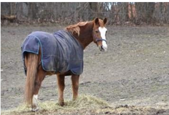
Foto 22. Caballo con una manta de invierno.

Durante los meses fríos de invierno, pueden utilizarse mantas de exterior impermeables y transpirables para proteger a los caballos de malas condiciones meteorológicas.