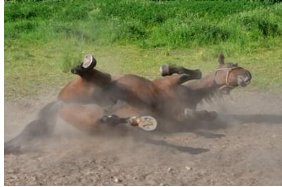
Foto 6. Rodar sobre la arena.

Aunque los caballos son animales sociales, tienen un espacio social que define la distancia que desean conservar a otros caballos. Esta distancia es individual y depende de la edad y del grado de reconocimiento entre ellos. Durante el aseo social, por ejemplo, la distancia es cero. También pueden verse juntos al intentar mantener alejados a los insectos. Los potros y caballos jóvenes parecen tener un espacio social muy estrecho o menos desarrollado, por lo que pueden verse tendidos todos juntos. Cuando los caballos son alojados en grupos, es importante tener en cuenta el espacio social a la hora de decidir cuánto espacio se les debe proporcionar.