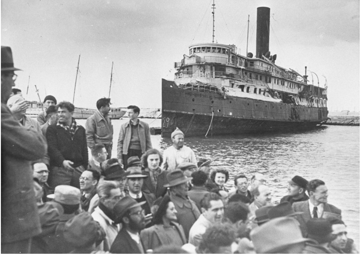
Gemilerle akın akın İsrail'e gelen Yahudiler.

Fakat bu tür tedbirlere kızmak ve karşı gelmek Araplara karşı yürütülen ayrımcılığa ayak uydurmuştur. 1976 yılında politik dert ve sorunları sonunda patlamış ve "Toprak Gününde" bütün Arap azınlıkların katıldığı bir günlük protesto eylemleri İsrail ordusu ve polisi tarafından vahşice bastırılmıştır. Bu olay, nüfusun yedide birini oluşturmalarına rağmen, devlet için potansiyel bir tehdit olarak algılanan İsrail Arap nüfusuna karşı resmi hoşgörüsüzlüğü iyice güçlendirmiştir.