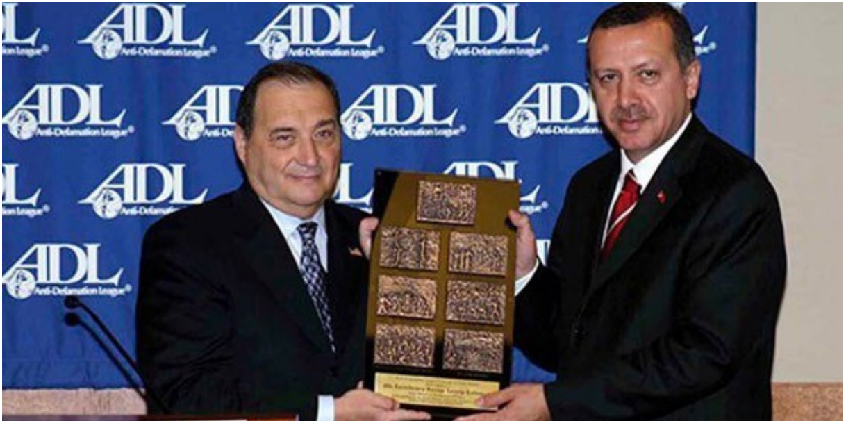
Erdoğan Türkiye Halkı adına "Courage to Care" ödülünü alırken.

Başbakan Ariel Sharon ile yaptığı görüşmede Recep Tayyip Erdoğan, Yahudi aleyhtarlığını "insanlık suçu" olarak nitelendirmiştir. 2006 yılında İsrail Dışişleri bakanı Türkiye ile olan ilişkilerini "mükemmel" olarak nitelendirmiştir. Kasım 2007 ayında İsrail Başkanı Shimon Peres, Türkiye Cumhurbaşkanı Abdullah Gül ile birlikte Türkiye Büyük Millet Meclisinde bir konuşma yapmıştır.