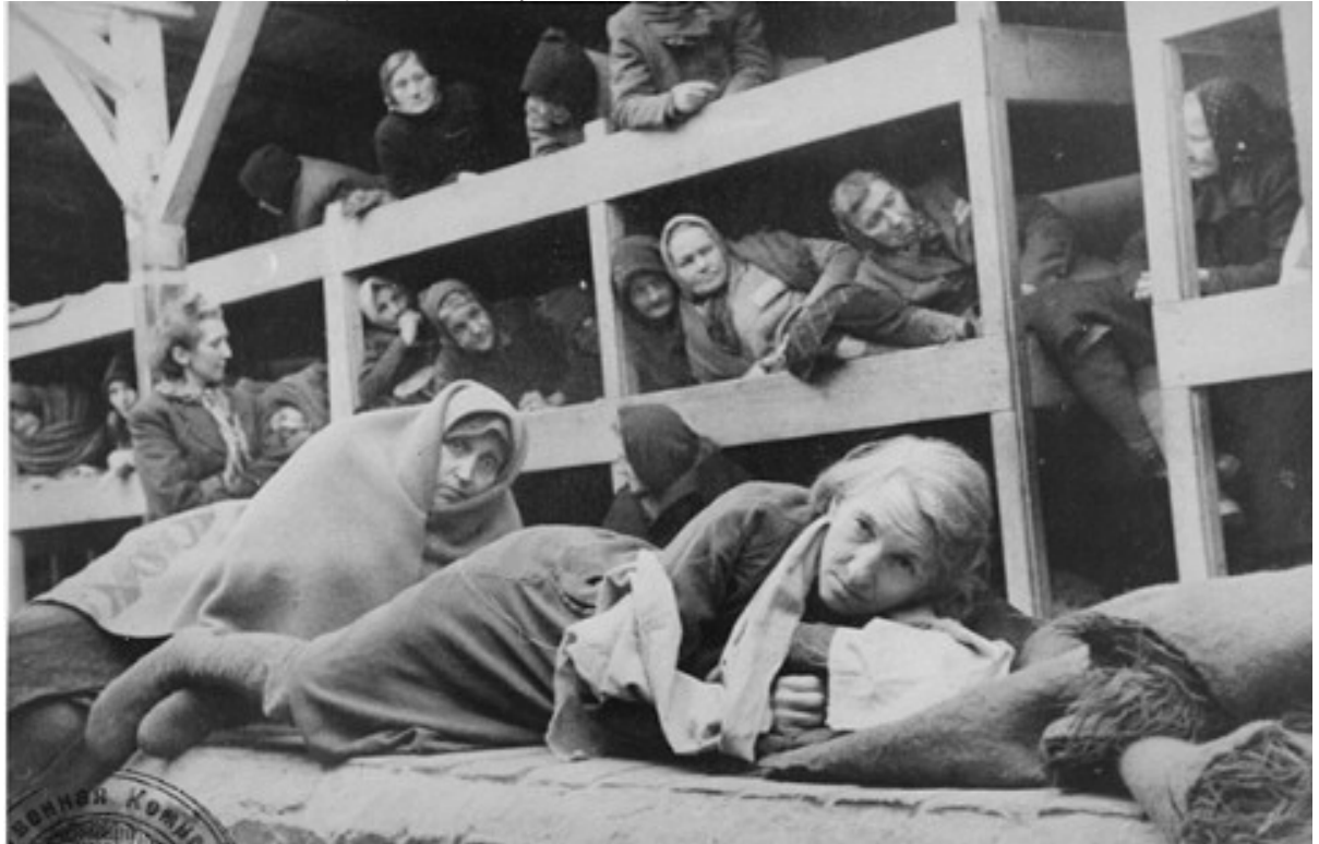
Sovyet kuvvetleri tarafından Auschwitz kampında kurtarılan kadınlar. Auschwitz, Polonya, 1945

Her insan evini ve ailesini savunma hakkına sahiptir, bununla beraber Batının gözündeki vatanları çalınan bir Filistinlinin onu Yahudilere karşı savunma hakkı yoktur. Özellikle yüzyıllar boyunca Yahudi vatandaşlarına eziyet eden Avrupalılar suçluluk duygusuyla yaptıklarının pişmanlığını hissediyor olabilirler. Bu suçluluk duygusu İsrail'in savaş suçlarının örtülmesinin nedeni olabilir. Avrupalılar Yahudilere karşı işledikleri suçların bedelini ödemek zorundadır, fakat ne yazık ki bu ödeme bugüne kadar suçu işleyenler tarafından yapılmamıştır. Bu bedeli anavatanları ellerinden alınan Filistinliler ödemiştir ve ödemeye de devam etmektedir.