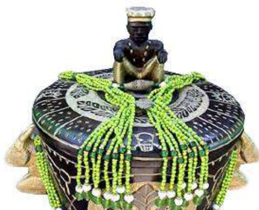
Orula ou Orunmila

As figuras representam os assentamentos a Oxum , Xangô e Orula ou Orunmila . Cada uma delas tem diferente cor, forma e material. Cada um dos elementos identifica os diferentes orixás e está relacionado com a mitologia. Os assentamentos se colocam num nível inferior ao do orixá congratulado, o qual é posto no patamar superior do trono.