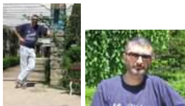
Formatos retrato y apaisado

Nosotros vamos a tener en cuenta los dos. Sin olvidar que aunque sea una opción menos extendida que antes, muchas de las fotos digitales también terminan en papel.