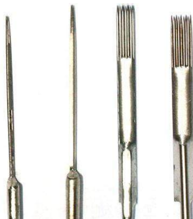
AGUJAS RS Y MAGNUM