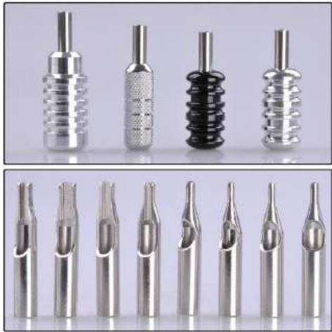
GRIP Y TIP