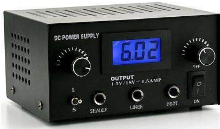
FUENTE DE ALIMENTACIÓN