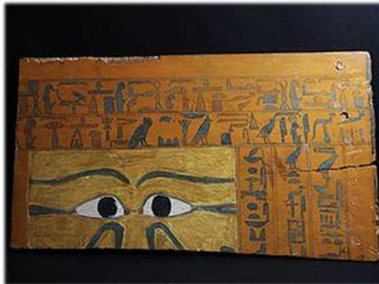
Египетски натпис на дрво

пишувало со писалка наречена стилус ( stylus ). Стилусот бил направен од метал, дрво или слонова коска и имал две страни. Едниот крај бил заострен и служел за пишување, односно гребење врз восокот, а другиот крај бил плоснат и служел за израмнување на восокот. Овие таблички се употребувале во црквата, во манастирските училишта но и во секојдневниот живот за пишување на разни белешки, сметки, трговски договори, писма и др.