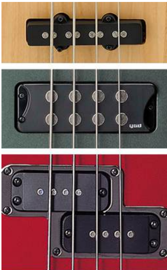
Desde arriba: bobina única, bobina humbucker, bobina dividida

Las silletas de latón ofrecen una gama de graves ligeramente más profunda, mientras que las placas de acero del puente ofrecen más respuesta. Todos los tornillos y resortes están hechos de acero inoxidable para protegerlos de la corrosión. El BB400 está equipado con un puente ligero de tipo vintage, con un saliente de compensación para la cuerda Mi grave.