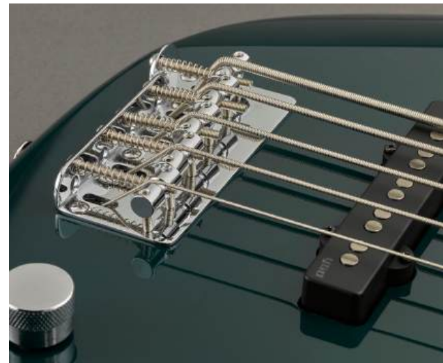
Un encordado en diagonal a través del cuerpo

Los bajos de la serie BB de Yamaha utilizan un encordado en diagonal a través del cuerpo, en el que las cuerdas se angulan en la silleta y pasan a través del instrumento, hasta el puente, en un ángulo de 45°, en oposición al método de encordado vertical tradicional, que pone más tensión en las cuerdas. El encordado en diagonal a través del cuerpo reduce considerablemente esa tensión, al tiempo que transmite la vibración de las cuerdas al cuerpo de manera confiable y eficiente. Las cuerdas también se pueden fijar al cordal del puente, que viene equipado con una silleta convertible que se puede ajustar en dos ángulos diferentes para una conformación y sensación tonal más precisa. El lado más