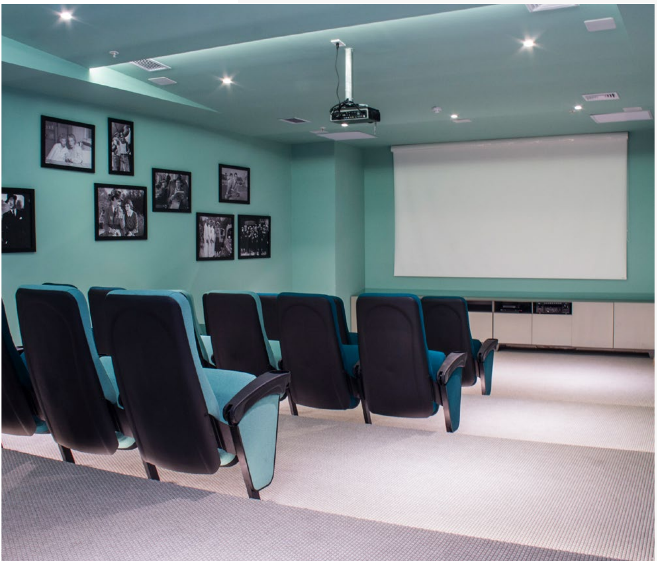
Atelier_ Sala de Cine

El contexto actual, nos deja claro algo: quien empiece a invertir en ladrillos estará haciendo un buen negocio. Ya que aunque pase el tiempo el ladrillo se podrá tocar, habitar, alquilar o vender.