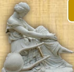
Мермерна скулптура на лирската поетеса Сапфо