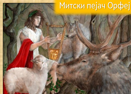
Митски пејач Орфеј

Античката лирика е поделена на хорска и монодиска . Песните од хорската лирика се составувале за пеење во хор по повод некој настан или за некоја бележита личност, додека песните од монодиската лирика имале поинаква намена, тие се пееле само од страна на едно лице кое често било творец на песната.