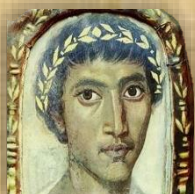
Ликовен портрет на Катул