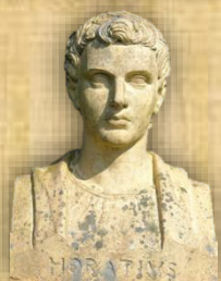
Биста на Хоратиј

Сапфо се смета за првата поетеса која пишувала песни за љубовта, уживањето и сетилните задоволства. Нејзините песни се зачувани во фрагменти.