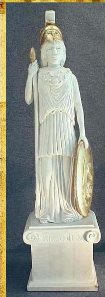
Реконструкција на Паладиумот