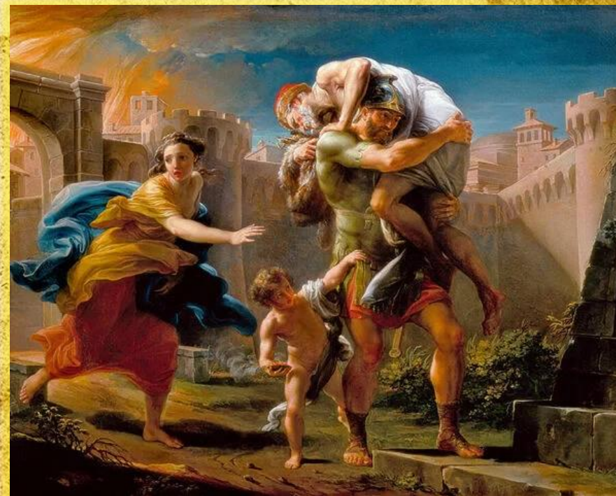
Ајнеј ја напушта Троја