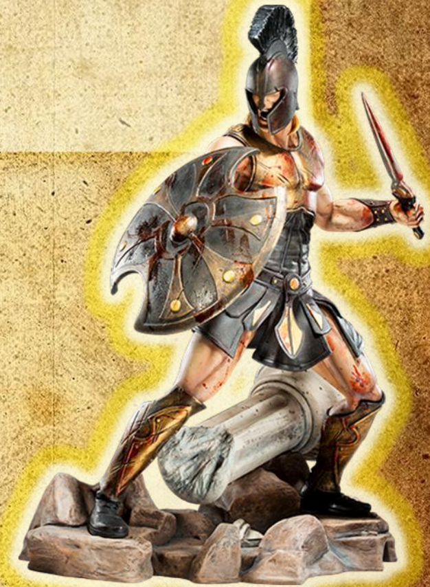
Ахил во борба