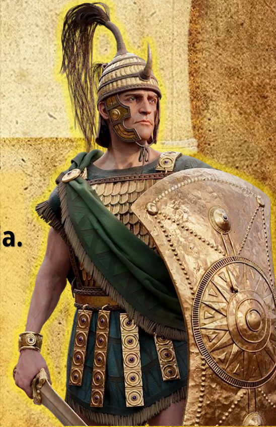
Ајнеј во тројанска воена облека