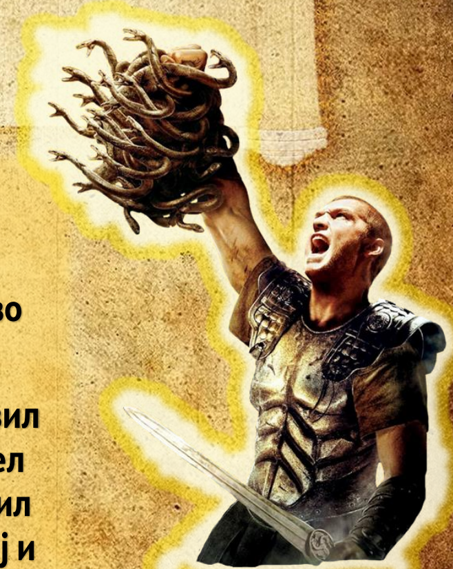
Персеј со главата на Горгона Медуса