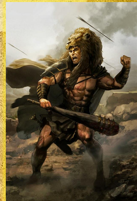
Херакле во лавовска наметка со тојага во рака