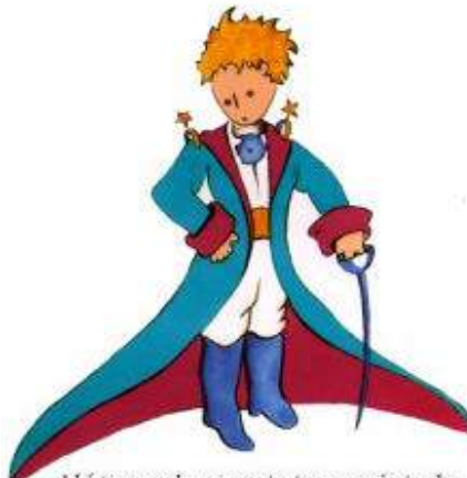
Aquí tienen el mejor retrato que más tarde logré hacer de él

Me puse en pie de un salto como herido por el rayo. Me froté los ojos. Miré a mi alrededor. Vi a un extraordinario muchachito que me miraba gravemente. Ahí tienen el mejor retrato que más tarde logré hacer de él, aunque mi dibujo, ciertamente es menos encantador que el modelo. Pero no es mía la culpa. Las personas mayores me desanimaron de mi carrera de pintor a la edad de seis años y no había aprendido a dibujar otra cosa que boas cerradas y boas abiertas.