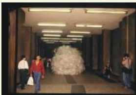
Projeto A Escala Pública Cildo Meirelles Galeria Prestes Maia