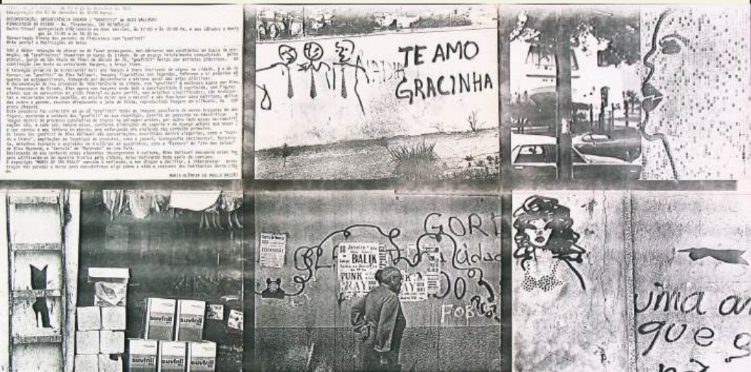
Cartaz/folder da exposição individual “Muros de São Paulo”, Alex Vallauri, Pinacoteca do Estado de São Paulo.