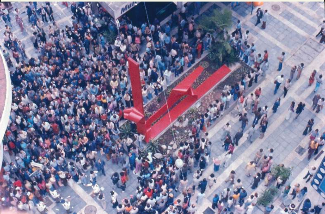
Inauguração do Calçadão das ruas 24 de Maio e D. José de Barros com a escultura Progresso , de Nicolas Vlavianos. Data de Inauguração: 16/12/1976.