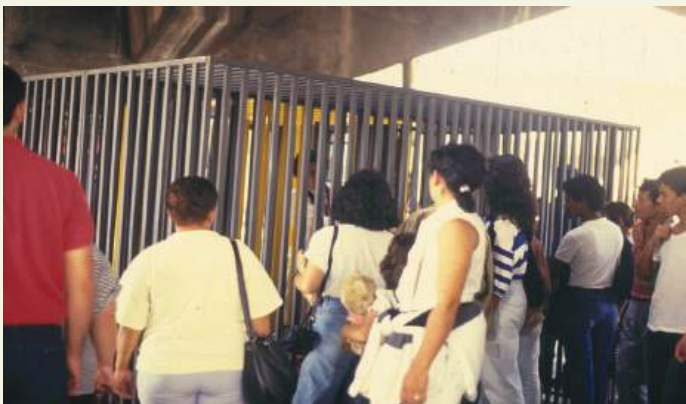
Cela Forte/Cela Protegida , estações do Metrô: Santana e Jabaquara