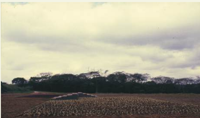
Waltércio Caldas Jardim Instantâneo , Parque do Carmo