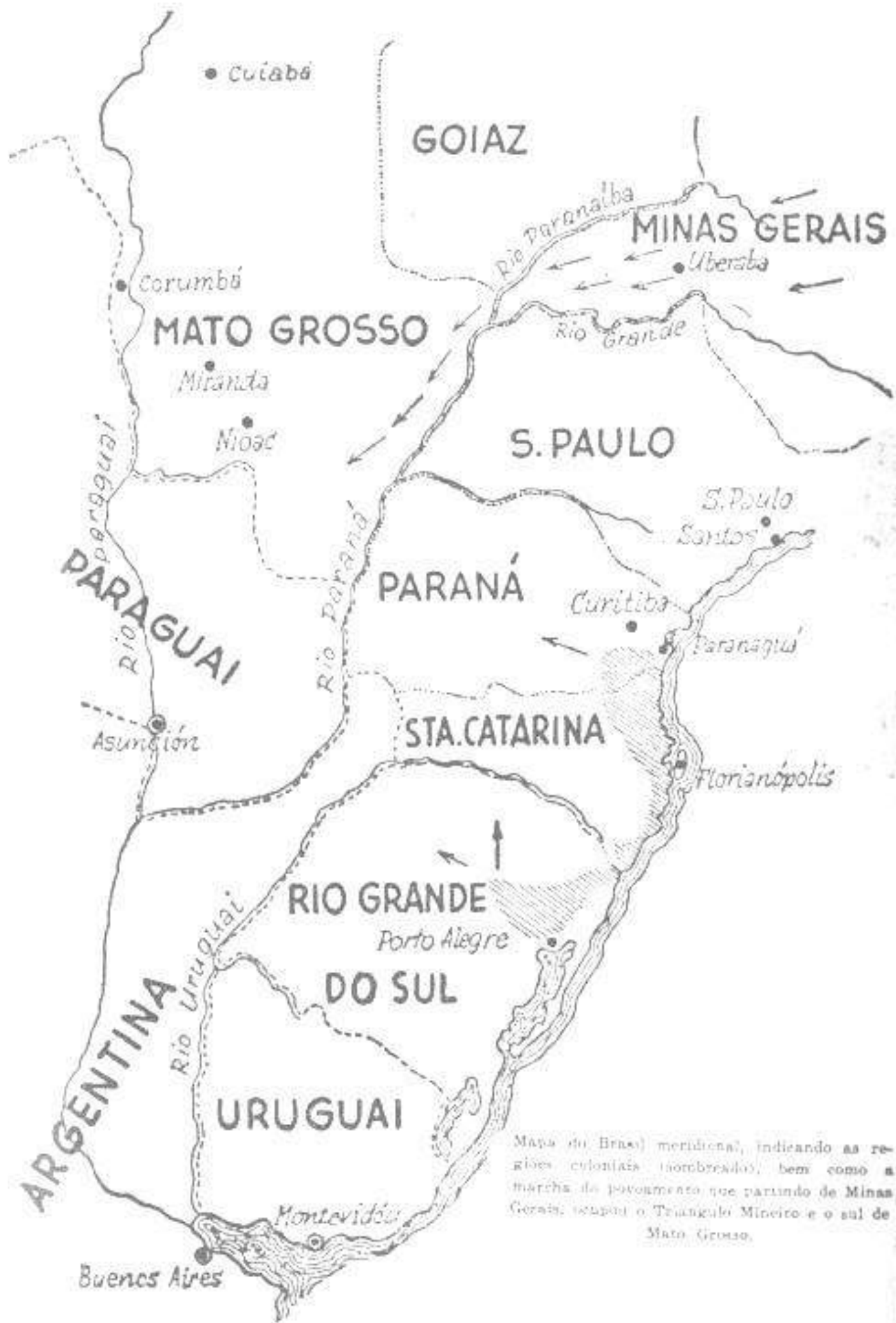
Mapa do Brasil meridional, indicando as regiões coloniais (hachuradas), bem como a marcha do povoamento que partindo de Minas Gerais ocupou o Triângulo Mineiro e o sul de Mato Grosso.