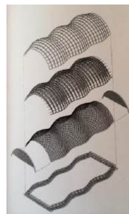
Plano axonométrico de la forma ondulada del Pabellón.

La primera idea estructural era la de un arco de tubos de papel que formase un túnel. Sin embargo, la Cúpula de papel suponía un coste elevado de las articulaciones de madera. Así que Ban propuso una rejilla utilizando 440 tubos de cartón de 40 m de longitud y 12 cm de diámetro, atados entre ellos con cintas de poliéster; el arco del túnel medía unos 73,8 m de largo, 25 m de ancho y 15,9 m de altura. Los cimientos estaban compuestos por una estructura de acero y tablas de madera rellenas con arena.