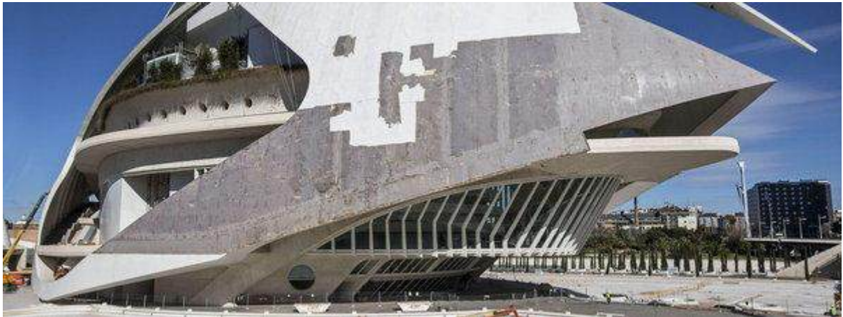
Retirada del revestimiento cerámico del Palau de les Arts Manuel Bruque

Cultura | 30/01/2014 - 15:20h | Última actualización: 30/01/2014 - 17:39h