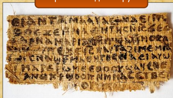
Фрагмент од папирус