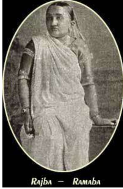
Rajba — Ramaba