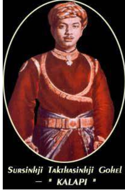
Sursinhji Takhtasinhji Gohel — " KALAPI "