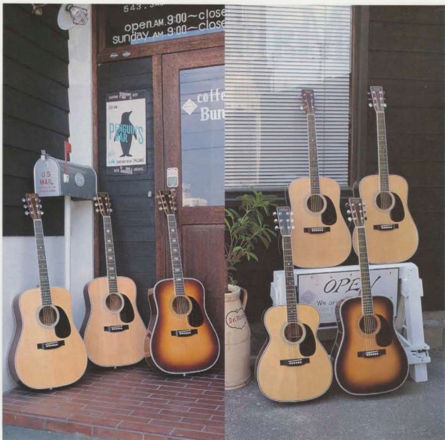
(左から)TCE30 / TCE35 / TCE35ST