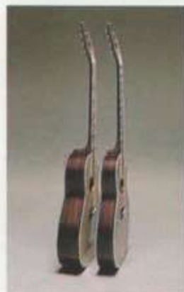
(左)ディープボディ(右)シャロウボディ