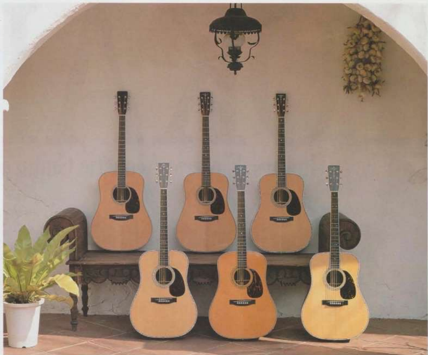
(後列左から)TCM120S / TCM50V / TCM80V / (前列左から)TCM300V / TCM150V / TCM200V