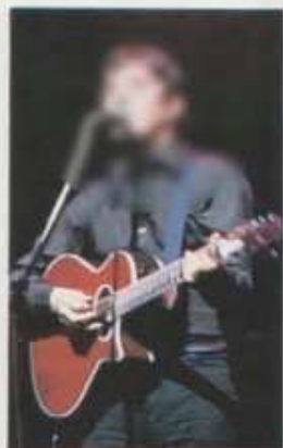
RICK DANKO (THE BAND)

TEA Deep Body & Shallow Body : TEAシリーズはこれまでのアコースティックギターと違い、ピックアップを内蔵したエレクトリックアコースティックギターです。ディープボディはアコースティックギター本来の味わい深いサウンドを大切にしています。シャロウボディはリードプレイやモダンロックミュージックのカッチングに大きな効果を発揮します。ピックアップはトニーカイオリジナル、サウンドはすでに定評のもの、シングルカッタウェイ、16フレットジョイント、25フレットはギタープレイヤーに高度な演奏性を提供します。