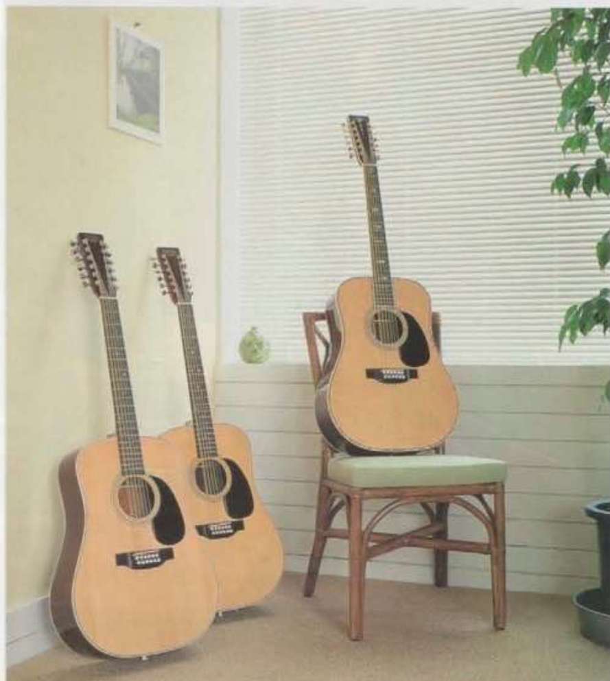
(左から)TCM60TW / TCE35TW / TCM120TW

TCM80T / VINTAGE 000-18 MODEL / ¥80,000: オーソドックスな000-18をオール单板でパーフェクトレプリカしたモデルです。コンパクトで弾きやすいボディ、優れたバランス、明るく澄んだ響きはレディスプレイヤーからプロフェッショナルまで多くのギタープレイヤーに愛用されています。 TCM100T / VINTAGE 000-28 MODEL / ¥100,000: スキャロップドXブレイシング、厳選されたマテリアルから生まれるクリアなサウンドは遠達性と指向性に優れ、ステージでもスタジオでも高度のパフォーマンスを約束します。 TCM250T / 1937 000-45 MODEL / ¥250,000: マーティンブリウオー000-45の設計思想を継承したパーフェクトレプリカモデル。アバロンパールをふんだんに採用したインレイ、優雅なスタイル、高度な演奏性、最良のクラフトワーク、究極のヴィンテージモデルです。(ギター¥236,000 専用ケース¥14,000) ●TCM・Tシリーズはすべて専用ケース付(別売)でお届けいたします。