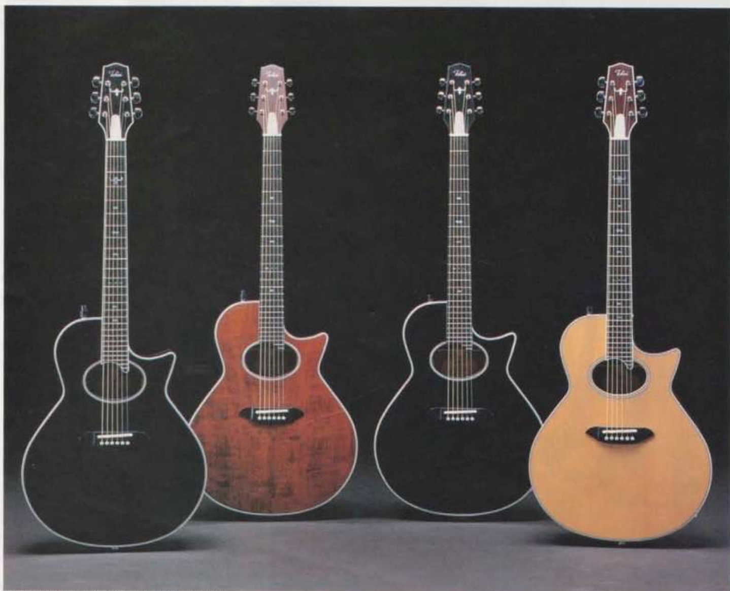
(左から) TEA80D-BR / TEA60D-AR / TEA60S-BB / TEA80S-S

TEA60D / ¥60,000 : アコースティックギターがもつ深い響きとニュアンスが大切にされたモデルです。コントローラーは1ボリューム、2トーンのテラケートな音作りを最重要視した設計、マホガニートーンを多彩に表現します。 TEA80D / ¥80,000 : ローズウッドトーンをプロデュースするTEA80、シングルラウンドカッタウェイの技巧はトニーカイ独自のものであり、絶妙なバンド技術が美しいカーブラインをえがきます。オヴエールサウンドホールはハウリング対策とサウンド追求から必然的に生まれたものであり、プロジェクトチーム独自のコンセプトにもとづいています。 TEA60S / ¥60,000 : リードプレイやロックミュージックのリズムカッチングなどに本領を発揮するシャロウボディのTEA。コントローラーの1ボリューム1トーン設計はライブパフォーマンスを重視した結果です。トップにはスプルース単板、サイド&バックにはマホガニーが採用され独特のマホガニートーンをプロデュースします。 TEA80S / ¥80,000 : アメリカンブルがインレイされたオリジナルデザインヘッドストック。単板スプルーストップ、ローズウッドサイド&バックが構成するボディコンストラクションのパーフェクトなパフォーマンスはエレクトリックアコースティックギターの基本。1ボリューム1トーンのコントローラー設計がくりひろげる新しいサウンドワールドを体験してください。