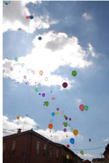
Suelta de globos con mensaje a la naturaleza.