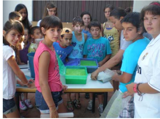
Durante el taller de papel reciclado.