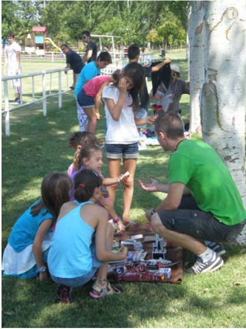
Mercado del trueque.