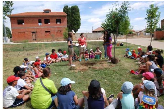
Diferentes momentos del ritual celta de plantación.