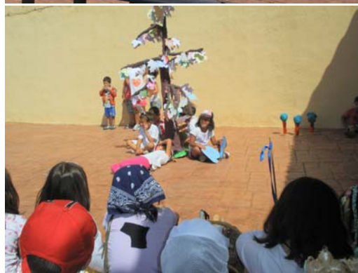
Diferentes momentos de la representación teatral.