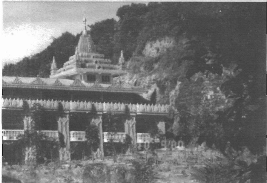
ပရိတ်: ဟားအောက်တောရဟန္တာသင်္ဃာတိုက်