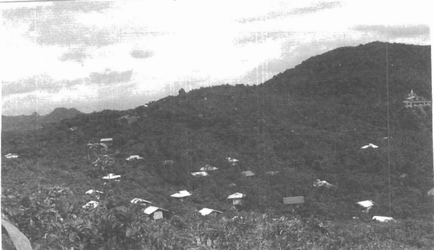
စိတ္တလတောင်ကျောင်း၊ ဖားအောက်တောရမ္မဒ္ဓသာသနာ့ရိပ်သာ Citta