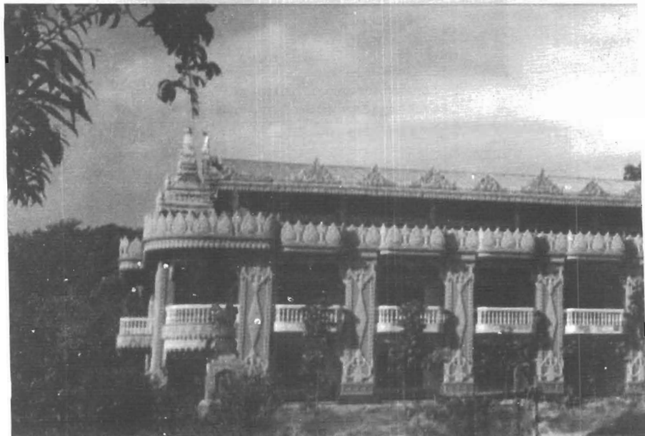
ဓမ္မဝိဟာရီသိမ်တော်ကြီး၊ စိတ္တလတောင်ကျ Dhammavihārī Sīmā, Cittalapabbatavihāra, P