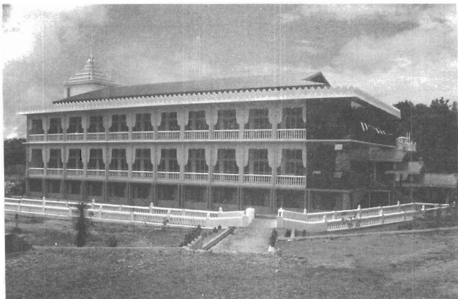
မေတ္တာဝိဟာရိဓမ္မာရုံ Mettā-vihāri Dhamma Mansion