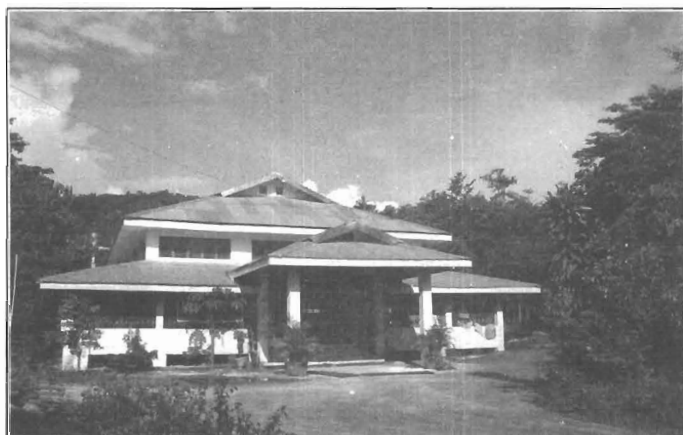
ဆွမ်းလောင်းရုံနှင့်ဓမ္မာရုံ Centre for offering food and for meditation