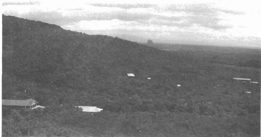
Upabbatavihāra, Pa-Auk Tawya Buddhasāsana Meditation Centre