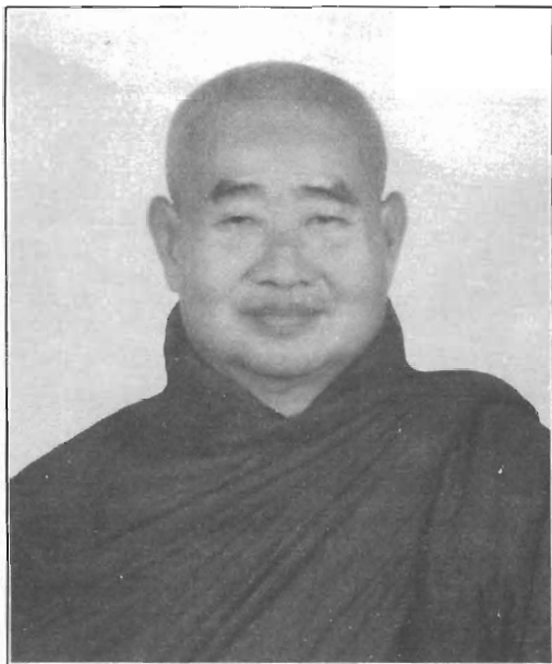
ဗားအောက်တောရဆရာတော် ဘဒ္ဒန္တအစိဏ္ဍ Pa-uk tawya Sayadaw Baddanta Ācīṇṇa