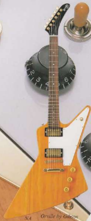
NA Orville by Gibson EX/Explorer