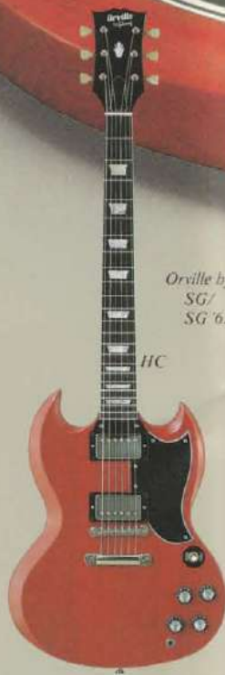
Orville by Gibson SG/ SG '62 Re-issue HC

Neck Specifications: マホガニー、W/ネックバインディング 24 \frac{1}{2} スケール、ローズウッドフィンガーボード 22フレット、デュアルポジションマーカー 17 \frac{1}{2} ピッチベックヘッド W/Orville by Gibson & スプリットダイヤモンドインレイ クルーソングタイプゴールドマッシュヘッド Body Specifications: マホガニー SG-CSTダブルカッタウェイ Hardware Specifications: 3xゴールドプレート・ギブソンオリジナル(U.S.A.) ハムバッキングピックアップ 2xメロトーン、2xトーン、3ウェイダブルスイッチ ゴールドプレートチューン・0/マチックブリッジ W/ストップバー チールピース ホワイトピックガード、ポテイトップブリック Finish: AW/アンティックアイボリー