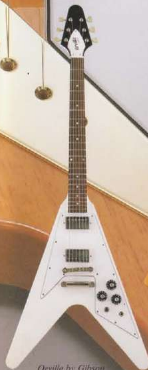
Orville by Gibson FV-74/'74 Flying V AW