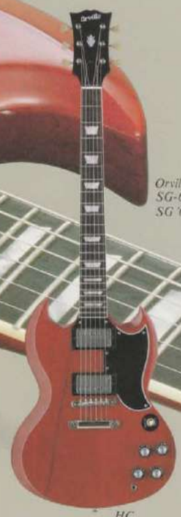
Orville SG-65/ SG '62 Re-issue HC