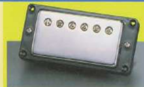
Gibson U.S.A. Pickups

Finish: CS/チェリーサンバースト、VS/ワインテージサンバースト ES/エボニー