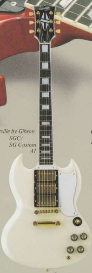
Orville by Gibson SGC/ SG Custom AW