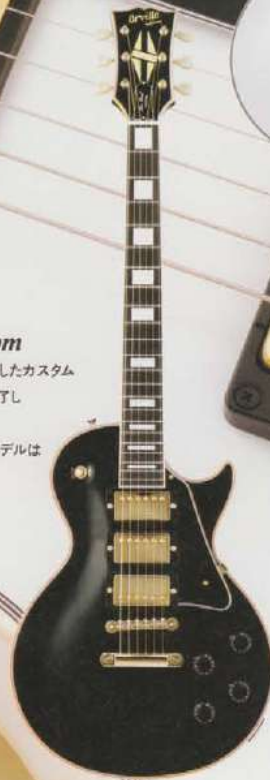
Orville by Gibson LPC-W/3P.U./ Les Paul Custom EB