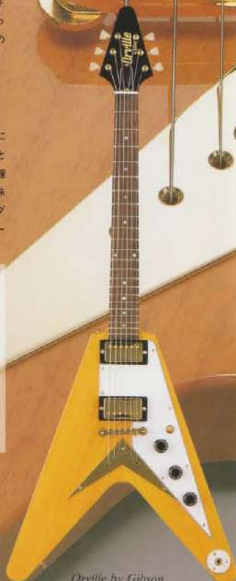
Orville by Gibson FV-58/'58 Flying V NA