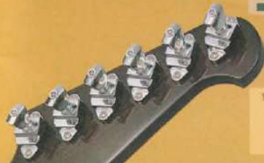
別売ファイアーバードペグ (6個1セット) クロム ニッケル ゴールド