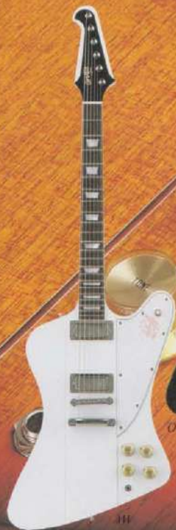
Orville by Gibson FB/Firebird