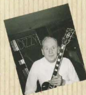
Mr. Les Paul with Orville by Gibson Les Paul Custom