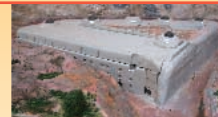
Grande Guerra "1915 - 18"