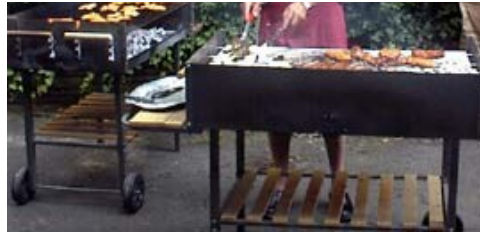
Ohne Grillmeister Klaus läuft nichts.