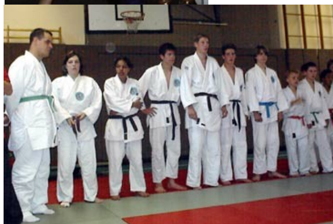
Die Judoabordnung aus Fourquex 0101 Das "Samurai" Aufgebot