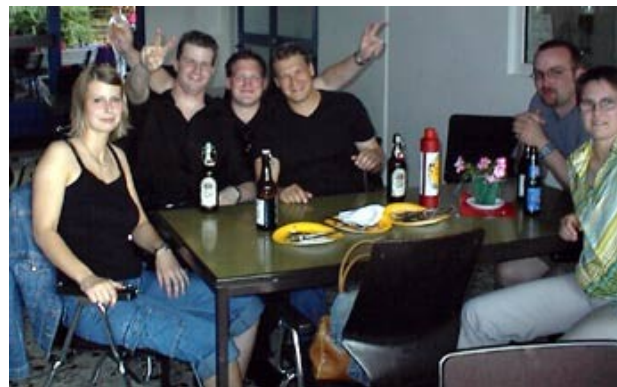
In guter Stimmung die Abteilung "Frankenheim Blue"