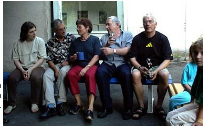
Die grauhaarigen Judopräsidenten unter sich.