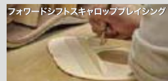
フォワードシフトスキャロップブレイシング

ダイナミクスレンジの広いスキャロップブレイシングを採用。豊かな生鳴りを実現しました。