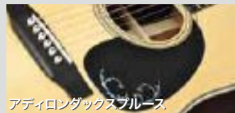
アディロンダックスプルース

指板からヘッドにかけてのツリー・オブ・ライフ、ピックガードのワンポイントなど見た目の豪華さも今までの限定モデルを超える仕様です。見た目もさることながら注目すべきはそのサウンド。アディロンダックスプルースと3ピースバックの相性が非常に良く、サスティン豊かで空間に広がるような鳴りを体験できます。HD, HF合せて50本のみ限定制作。ヘッドウェイのスタッフをして「飛鳥チームビルド史上、一番いい音がするギター」を言わしめた特別モデルの発売です。