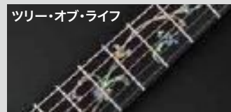
ツリー・オブ・ライフ