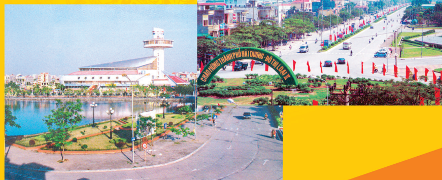
Đại lộ Nguyễn Lương Bằng.

TỪ NGÀY 10/12 ĐẾN 16/12/2017 TẠI ĐƯỜNG TÔN ĐỨC THẮNG - TP. HẢI DƯƠNG