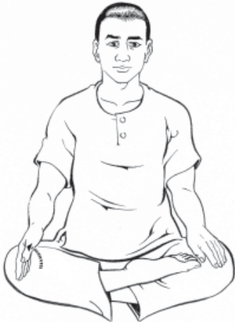
๒. พลิกมือขวาตะแคงขึ้น...ทำซ้ำ ๆ...ให้รู้สึก