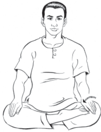
๑๕. ค่ำมือซ้ายลงที่ขาซ้าย...ให้รู้สึก ทำต่อไปเรื่อยๆ...ให้รู้สึก