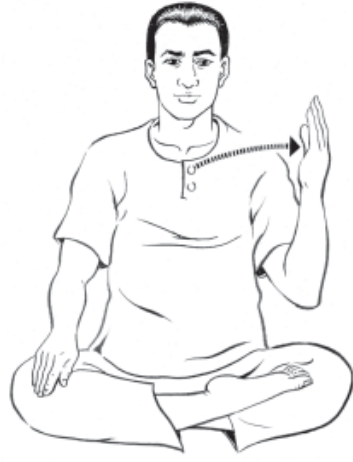
๑๓. เอามือซ้ายออกมาตรงข้าง... ให้มีความรู้สึก