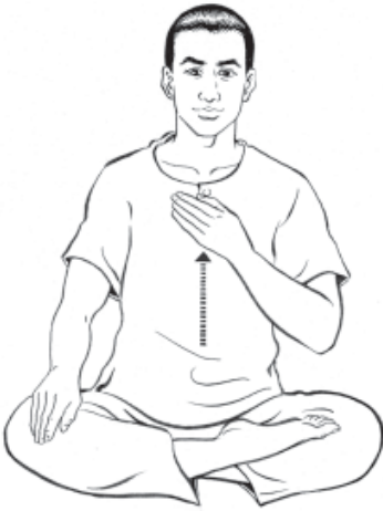
๑๒. เลื่อนมือซ้ายขึ้นที่หน้าอก... ให้มีความรู้สึก