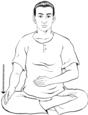
๑๐. ลดมือขวาลงที่ขาขวา ตะแคงไว้...ให้รู้สึก