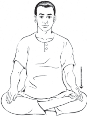
๑๔. ลดมือซ้ายลงที่ขาซ้าย ตะแคงไว้... ให้มีความรู้สึก