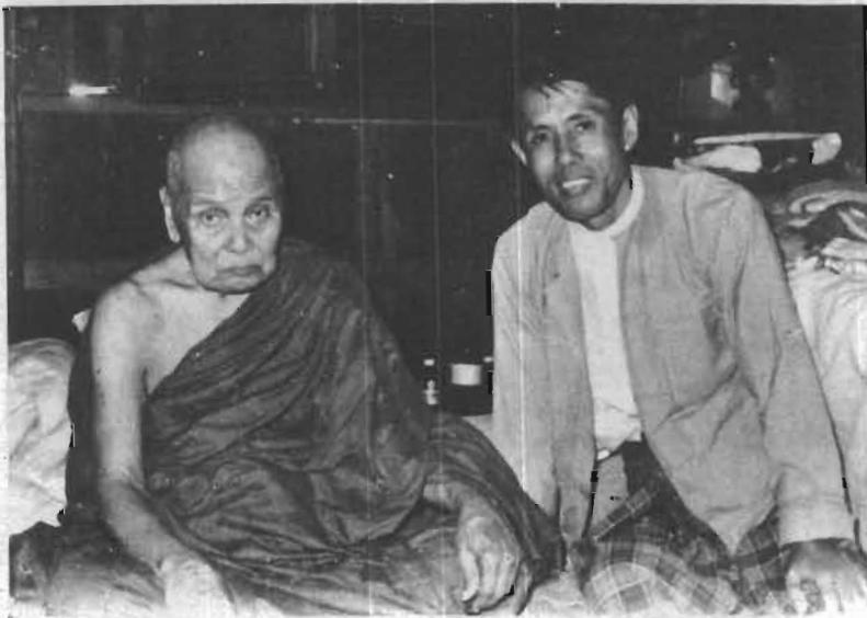
တော်ကူးဆရာတော်၏အသက်တော် ၉၆ နှစ်မြောက်နေ့၌ ဆရာတော်အား စာရေးသူနှင့်အတူ ပူးတွဲရပုံ