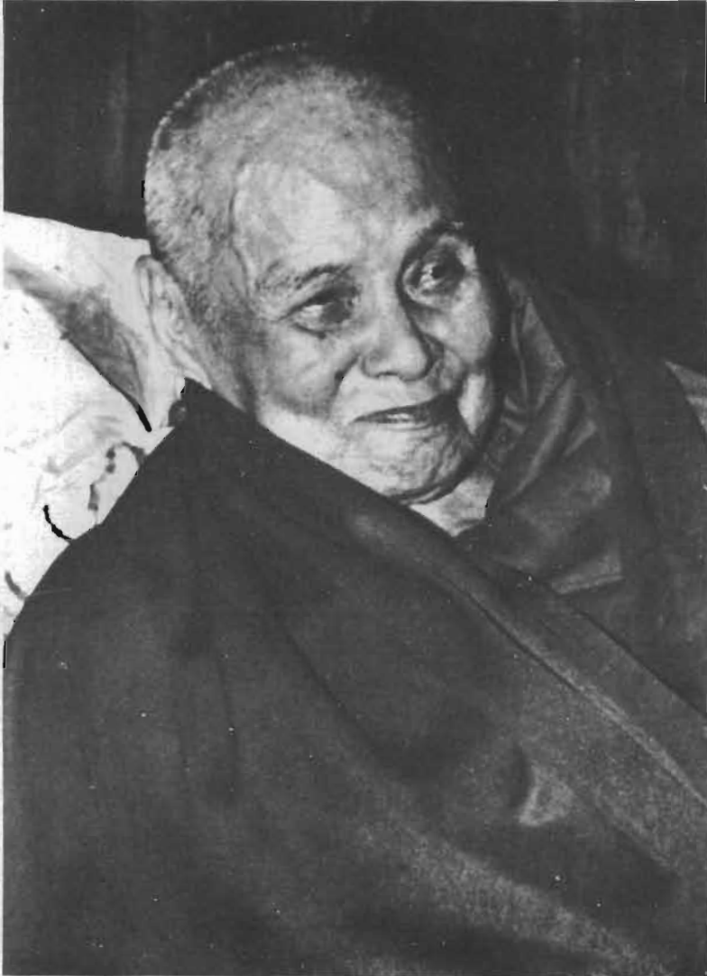
တော်ကူးဆရာတော် မပျံ့လွန်မီတစ်ရက်၌ ဆရာတော်အား ပြုံးကြည်စွာ ပူးမြင်ရပုံ။