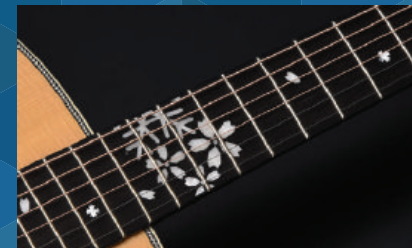
指板には雪と桜のインレイを大胆にレイアウト

HD-Fuyuzakura HF-Fuyuzakura HJ-Fuyuzakura