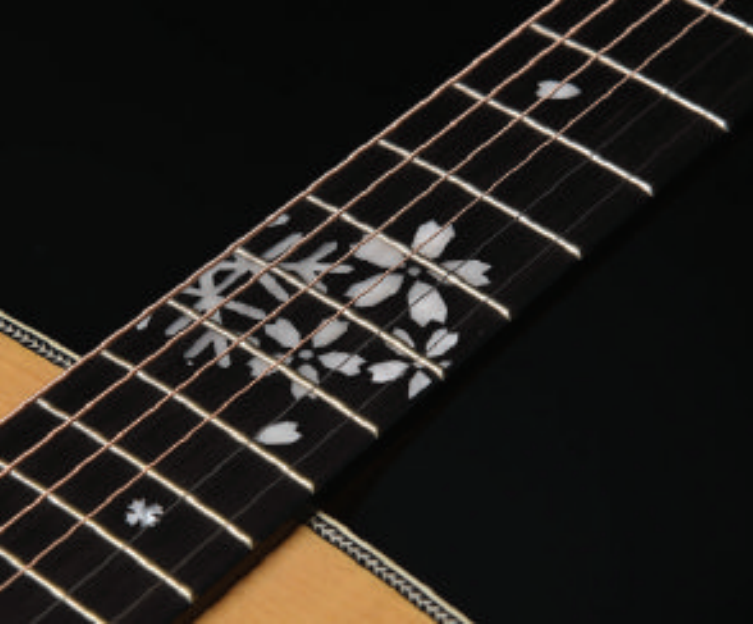
12フレットと5フレット付近に雪と桜をモチーフとしたインレイを大きく配置しました。