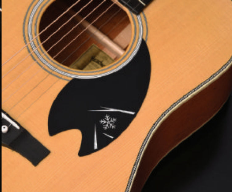
ピックガードには雪の結晶を。