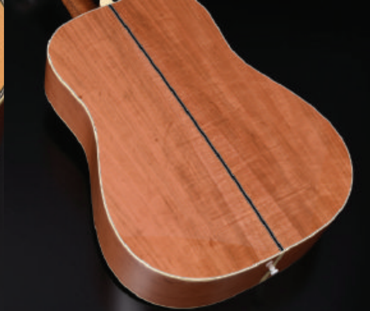
ボディのサイド・バックには桜の木を使用。一音一音粒のそろった音を生み出します。