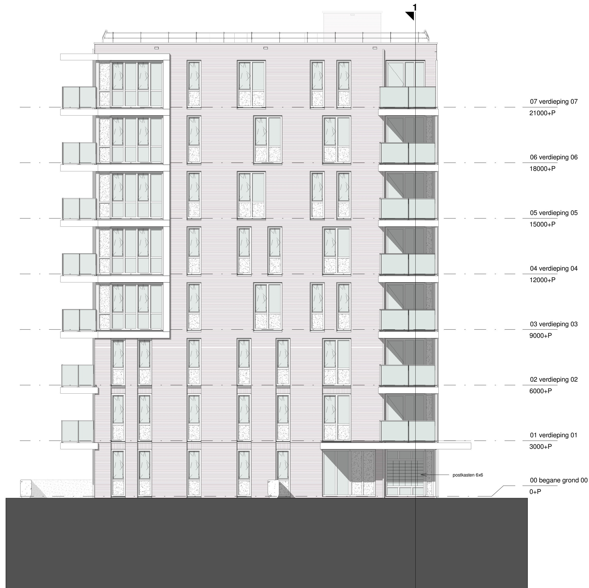
Toren III: Noordoost gevel