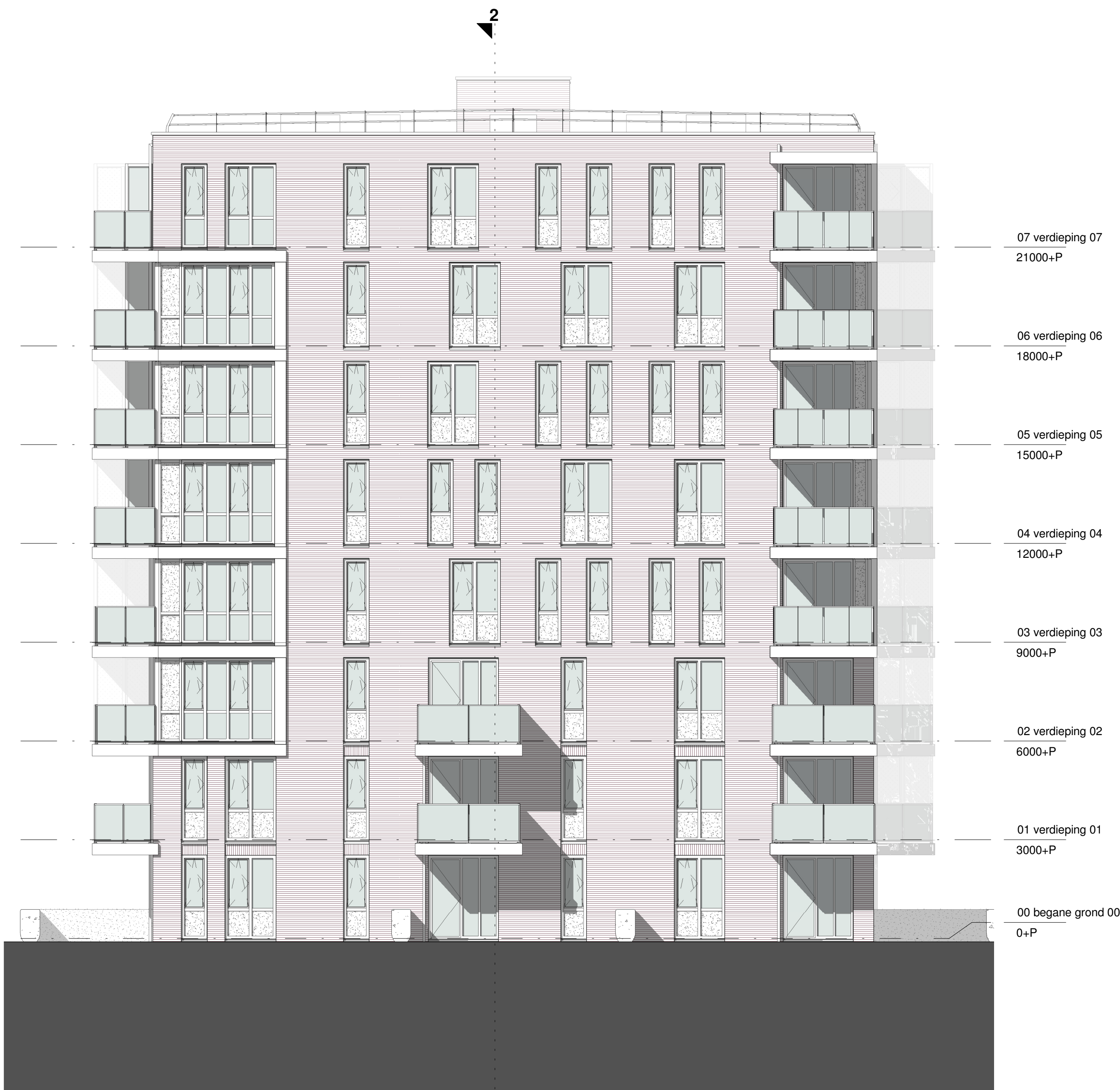
Toren III: Zuidoost gevel