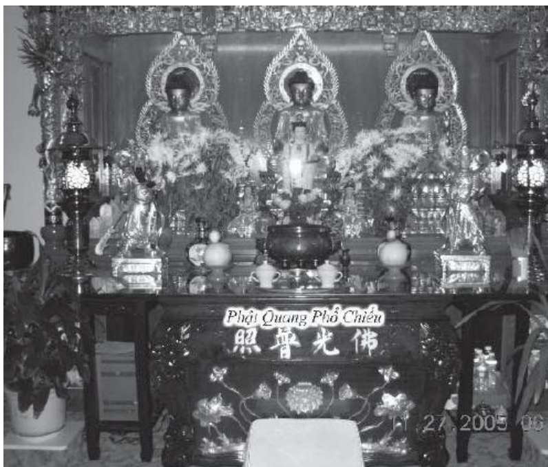
Chùa Kim Sơn, Gold Mountain Monastery