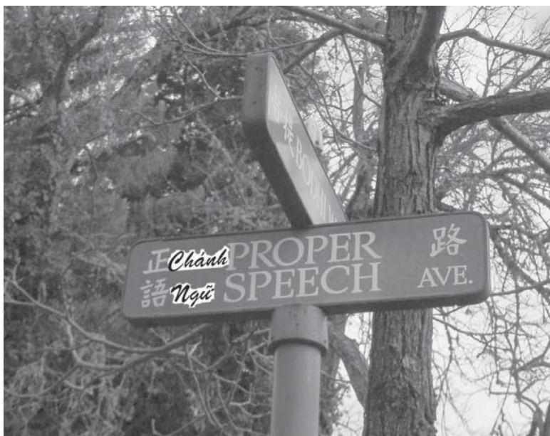
Đường Chánh Ngữ tại Vạn Phật Thành