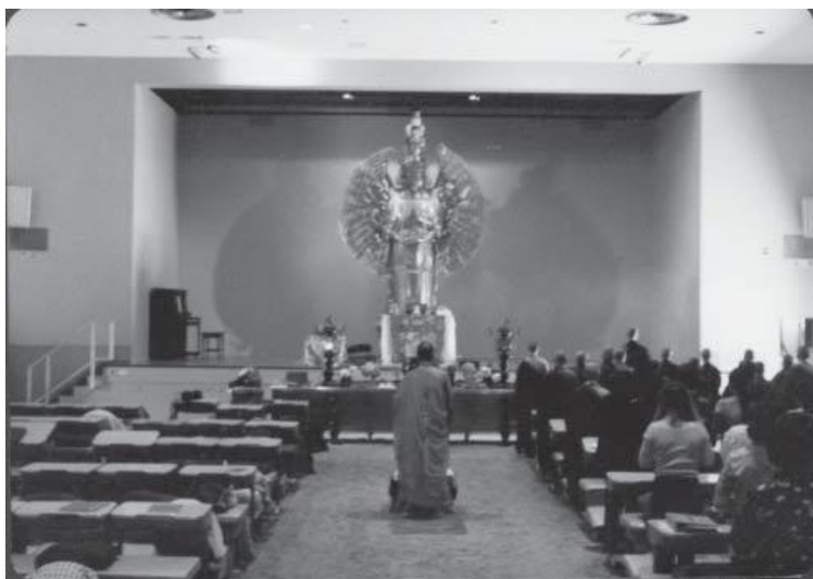
Vạn Phật Thành vào những năm đầu.