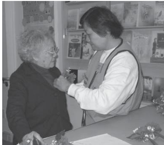
Lễ Kính Lão, Gold Mountain Monastery

Không tự tư, ích kỷ: Bất cứ vật gì thuộc về công cộng để mọi người thuận tiện dùng, chúng ta không được cất dấu cho riêng mình. Quý vị có thể bổ thí, tức là quý vị không có lòng tự tư, ích kỷ, gọi là: “Xem tất cả người già như cha mẹ ta, thương tất cả trẻ thơ như thương con em mình.” Đó là sự biểu hiện của người không có lòng tự tư ích kỷ. Sự thành lập các trường đại học, trung học, tiểu học và viện dưỡng lão tại Vạn Phật Thánh Thành vốn cũng từ tư tưởng đó.