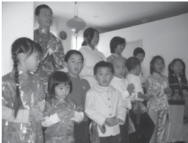
Các em học sinh tại Gold Mountain Monastery