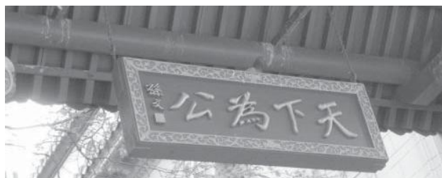
Thiên Hạ Vi Công, cổng China town, San Francisco