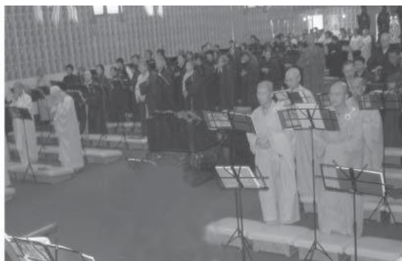
Khóa Lễ Vạn Phật Bảo Sám, Vạn Phật Thành - 05/2007

Vạn Phật Thánh Thành là nơi của vạn Phật hội tập lại. Cho nên mỗi năm vào mùa xuân, chúng ta cử hành đại pháp hội, với ba mươi ngày lễ bái Vạn Phật Bảo Sám, chuyên cầu nguyện cho thế giới hòa bình. Công đức lễ bái sám hối thì không thể nghĩ bàn, vì nó có thể tiêu tai tăng thọ và diệt tội tăng phước.