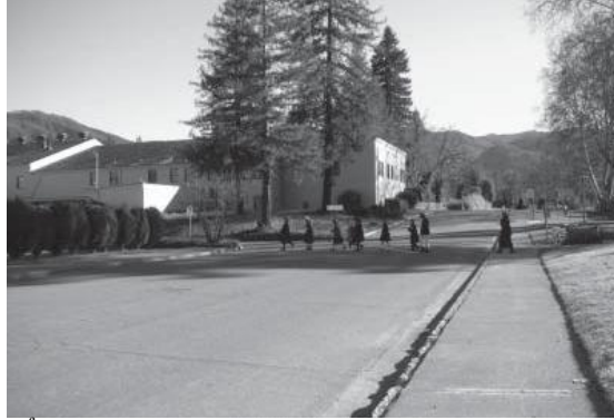
Các em học sinh tiểu học trên đường tới chánh điện tham gia khóa cúng nọ.

Hiện nay học sinh và thầy giáo đều vì tiền. Giáo sư nếu cảm thấy tiền lương không đủ, họ bèn đình công không dạy. Điều này đầu độc học sinh, khiến chúng cũng y rập theo khuôn tư tưởng như vậy, đến nỗi làm cho xã hội đi đến chỗ bại hoại luôn. Xã hội bại hoại là trách nhiệm của giáo viên và giáo sư! Hiện nay có nhiều trường rất hoang đàng, quái gở, như khuyến khích học sinh hút xách, tánh tình phóng đảng và tạo biết bao nhiêu chuyện phi pháp. Thời đại này so với thời Xuân Thu Chiến Quốc ở Trung Hoa còn bại hoại hơn nhiều. Thật vậy, phong cách nề nếp đời nay mỗi ngày một suy đồi, lòng người chẳng còn như xưa nữa. Giới giáo sư lại công nhiên phê bình: Vị Thánh nhân này không đúng, vị anh hùng nọ không tốt, ông tể tướng đó cũng không phải. Tóm lại, mọi người đều không đúng, duy chỉ có mình họ là đúng thôi. Vì sao như thế? Còn không phải là vì tiền ư! Giả như là họ đúng, thế thì bao nhiêu tiền tài cũng đều nên quy nạp về cho họ.