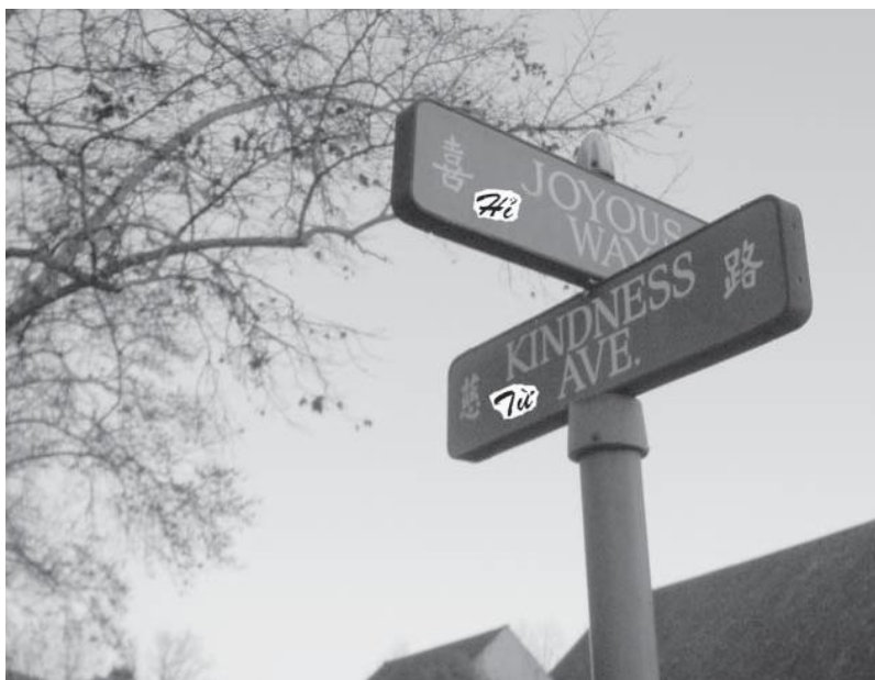
Đường Từ & Đường Hi tại Vạn Phật Thành