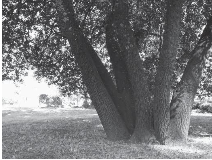
Cây cổ thụ ở Vạn Phật Thành