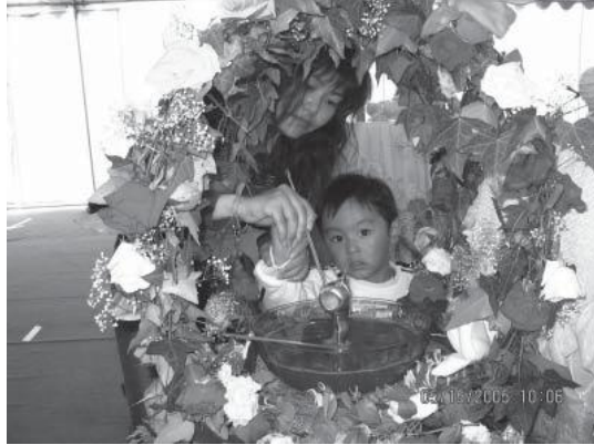
Hai mẹ con đang tắm Phật, Vạn Phật Thành