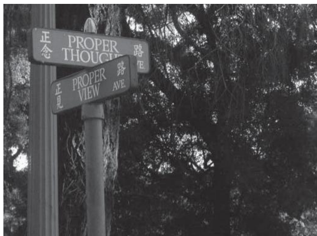
Đường Chánh Niệm & Chánh Kiến tại Vạn Phật Thành