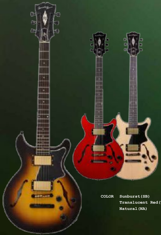
COLOR Sunburst (SB) Translucent Red (TRD) Natural (NA)