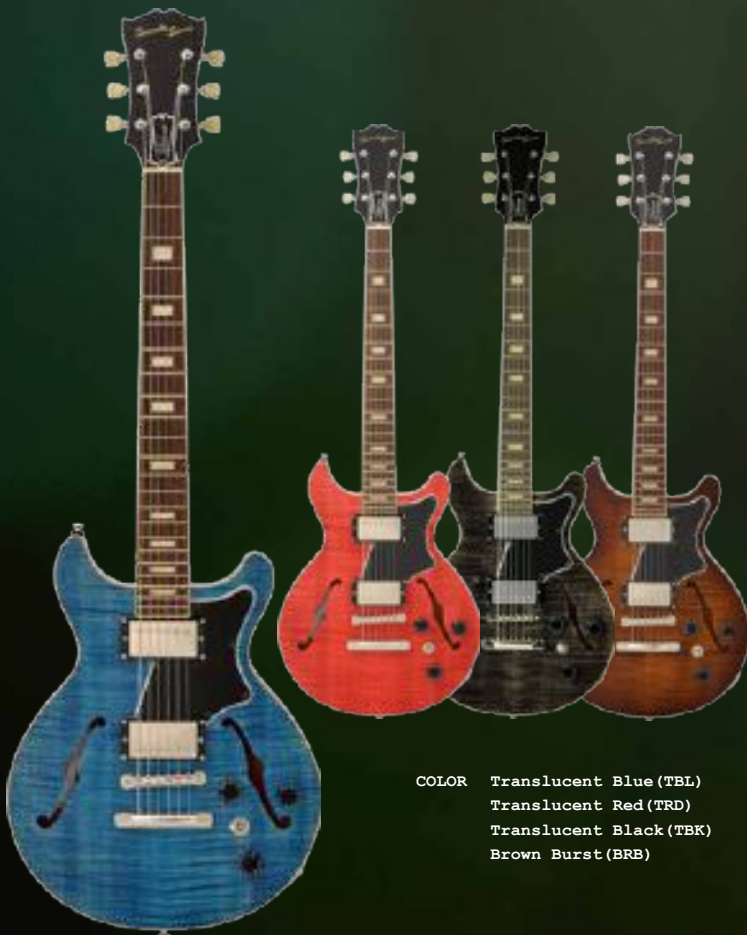
COLOR Translucent Blue (TBL) Translucent Red (TRD) Translucent Black (TBK) Brown Burst (BRB)

ALBATROSS-JAZZ OPEN PRICE 実勢価格 ¥160,000(+税)