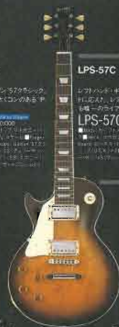
LPS-57C L/H /VS

LPS-57C Price: ¥80,000 ■Body: Maple / Pickups: Burstbucker Pro (H) / Burstbucker Pro (S) / Bridge: Tune-Matic / Hardware: Chrome / Finish: Sunburst ■Body: Maple / Pickups: Burstbucker Pro (H) / Burstbucker Pro (S) / Bridge: Tune-Matic / Hardware: Chrome / Finish: Sunburst