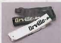
Original Straps Black, White, Brown ¥1,200

オービル製品にベストマッチするメンテナンススプレー「フィンガリング・ワンダー」は100%レモンオイルを配合、さわめてスムーズなフィンガリングを可能にするとともに、その成分がフレットボードのクリーニングに、ソリ、ワレの防止に、さらには弦の防錆にも効果を発揮します。