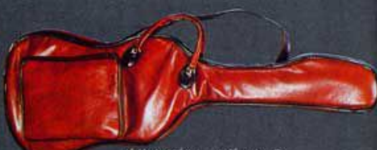
ギグ・タイプのショルダー・ケース

専用ケース オリジナルシェイプのギター用に 制作されたケースです。EXモデル やAIRモデルが完璧に収納でき、 ツアーなどに理想的です。 EG、MR用 ¥12,000 MD、EX用 ¥15,000 FVB、EXB用 ¥14,000 FV用 ¥13,000