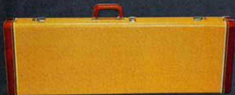
オールド・ケース