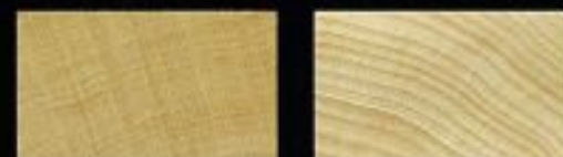
タイムレス・ティンバー・メイプル

試験片に一定の力を与えた時の動き(変化)の度合いです。T.T.メイプルが16.89Gpaでメイプルが15.29Gpaと1.6Gpaの差がありました。(数値が大きい程動きが少ない)T.T.メイプルの方が動きが少ないという結果がでましたが、これをギターの場合に当てはめてみると弦の張力(一定の力)とNECKの関係がわかりやすいです。