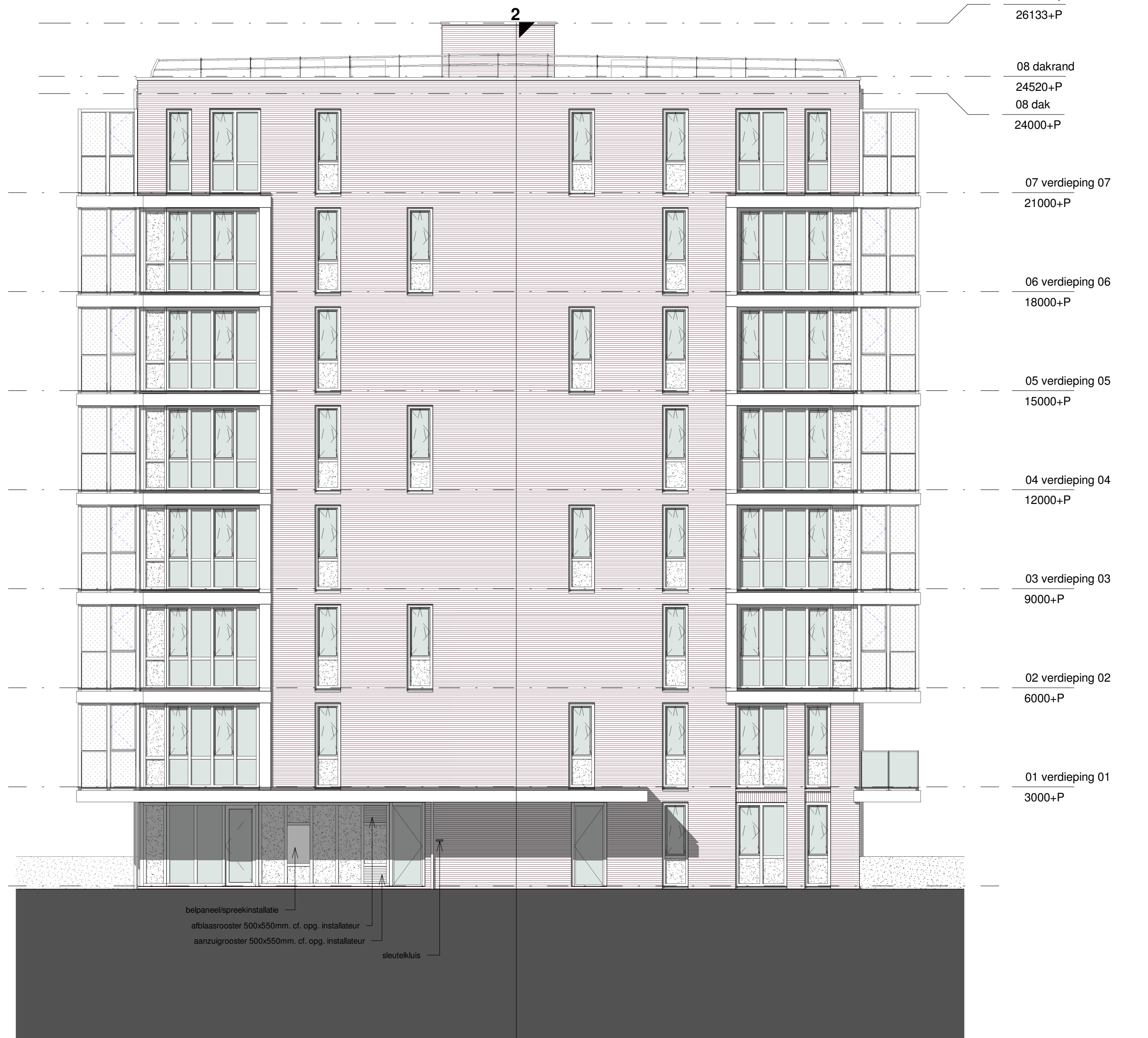
Toren III: Noordwest gevel