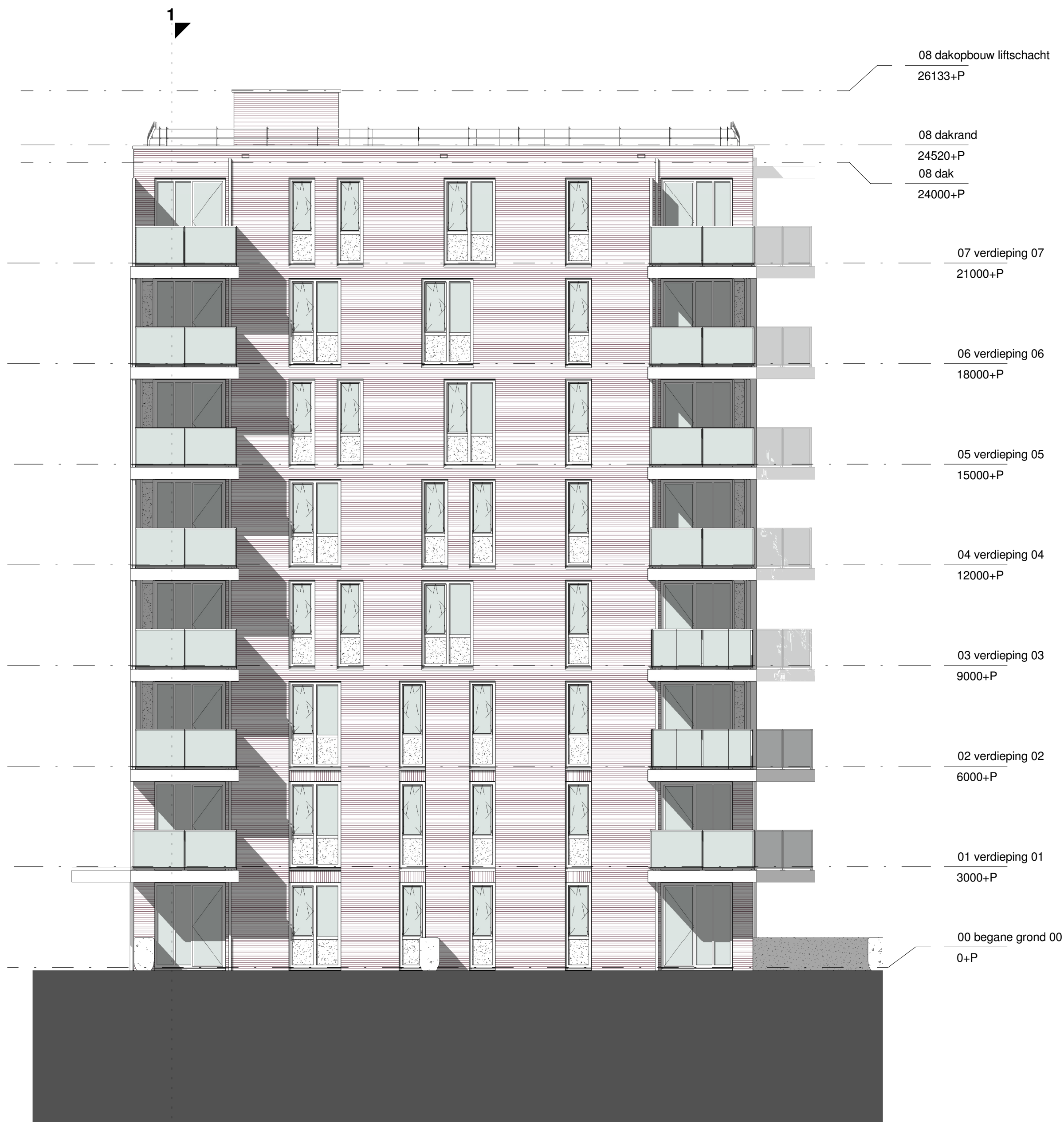
Toren III: Zuidwest gevel