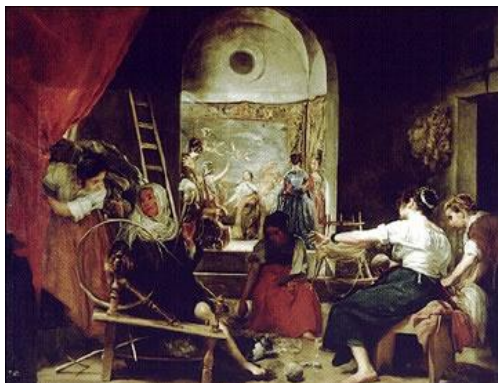
Las hilanderas de Velázquez