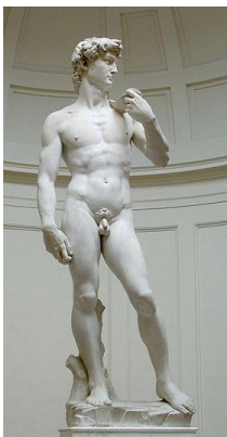
El David de Miguel Ángel