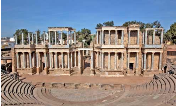
Teatro de Mérida