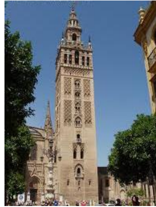
Giralda de Sevilla