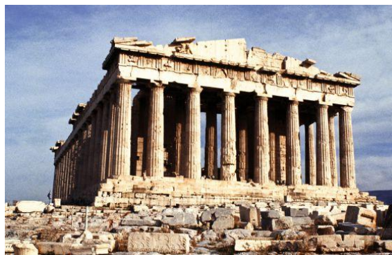
El Partenón de Atenas