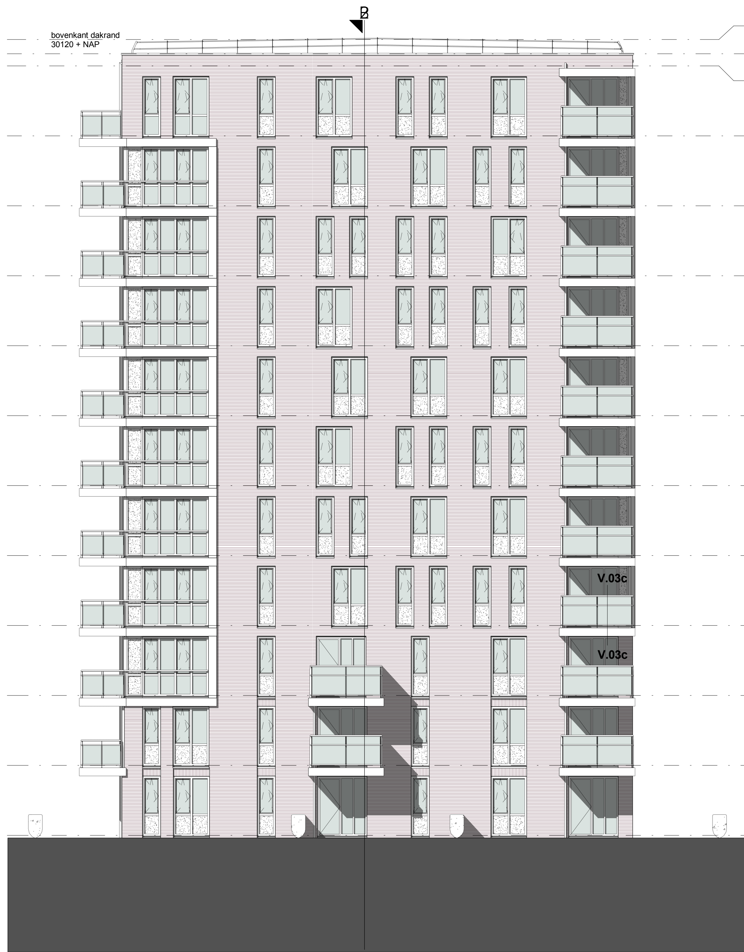
Toren II: Zuidoost gevel