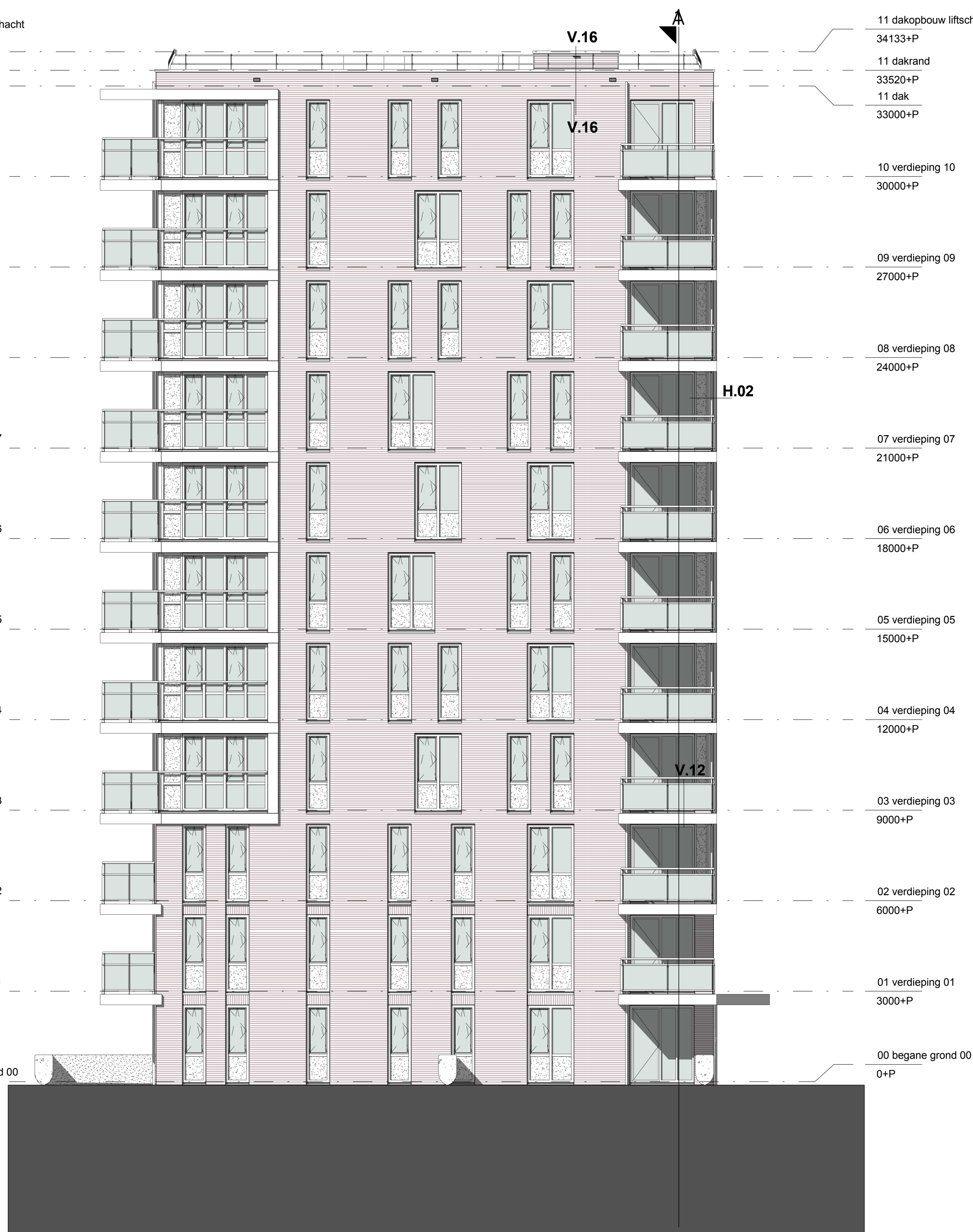
Toren II: Noordoost gevel