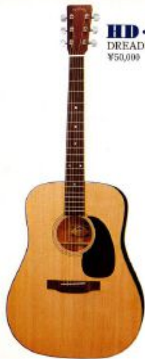
HD-305 DREADNOUGHT ¥50,000