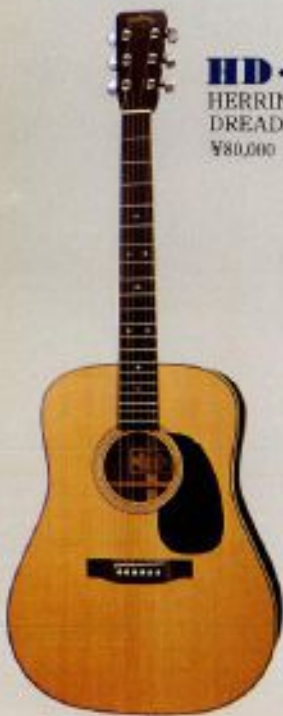
HD-108 HERRINGBONE DREADNOUGHT ¥80,000