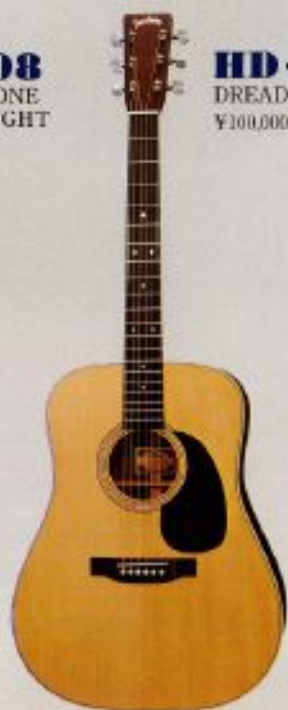
HD-110 DREADNOUGHT ¥100,000