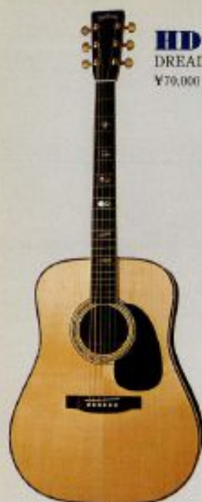
HD-207 DREADNOUGHT ¥70,000