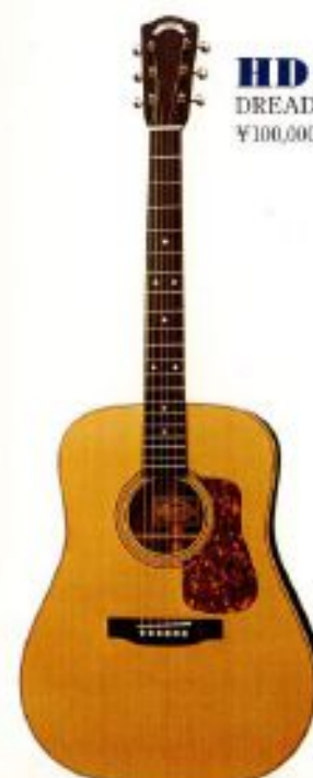
HD-510 DREADNOUGHT ¥100,000