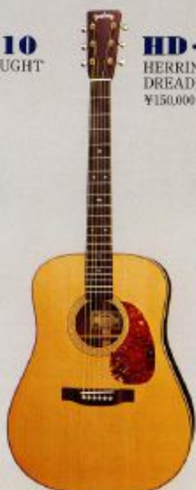
HD-115 HERRINGBONE DREADNOUGHT ¥150,000