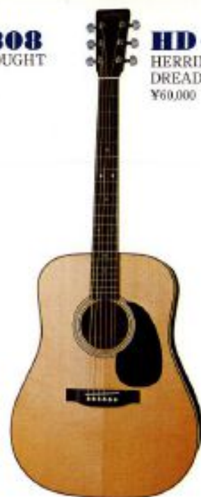
HD-106 HERRINGBONE DREADNOUGHT ¥60,000