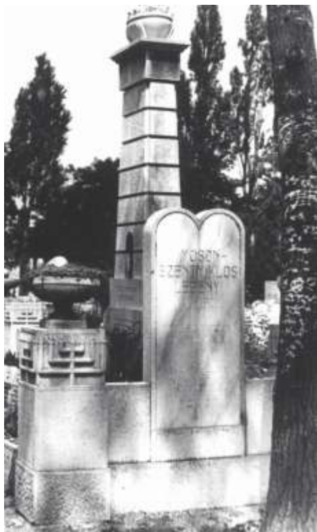
A munkaszolgálatos áldozatok lébény-mosonszentmiklósi emlékműve

Júliusban 73 kivégzett tömegsírját tárták fel, Egy részüket tarkón lötték, másokat félholtra verve élve temettek el.