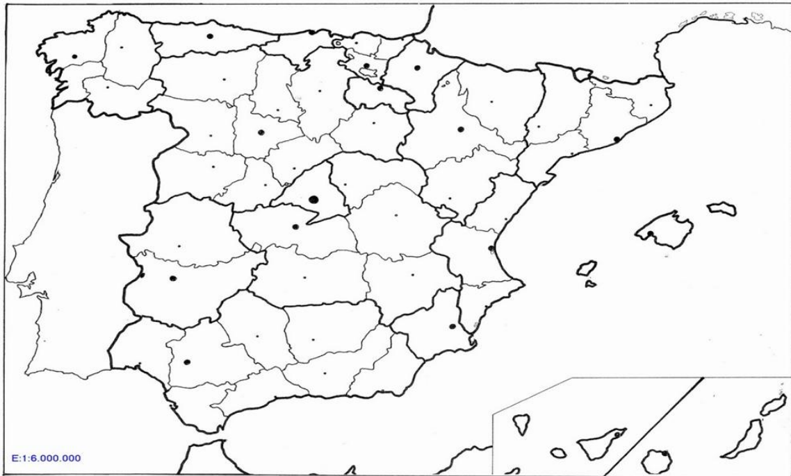
Mapa de Europa