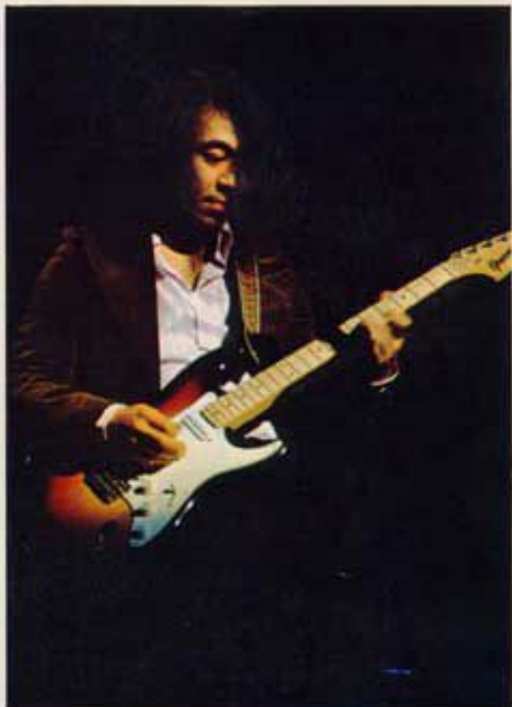
柳ジョージ / 成毛雄