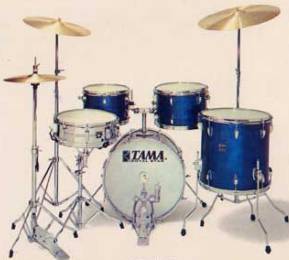
ステージマスター1 (シンバル別売) ¥106,000