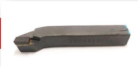
Ferramenta iso 9 8x8