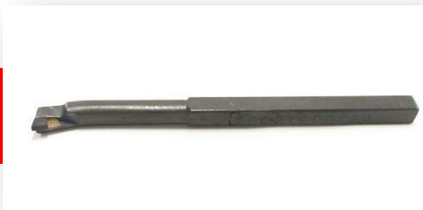
Ferramenta iso 9 12X12