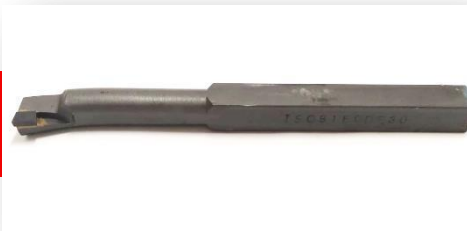
Ferramenta iso 9 20x20