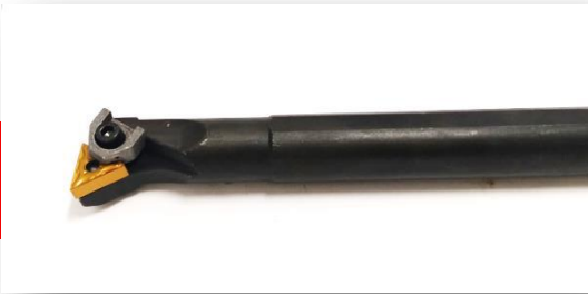
Suporte tnmg interno