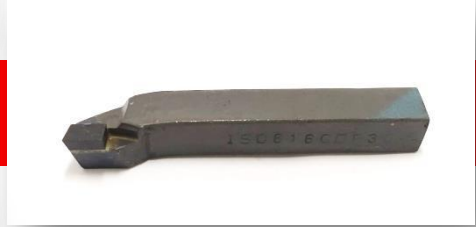
Ferramenta iso 6 20x20