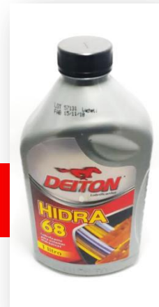
Óleo 68 para lubrificação de barramento e caixa do torno