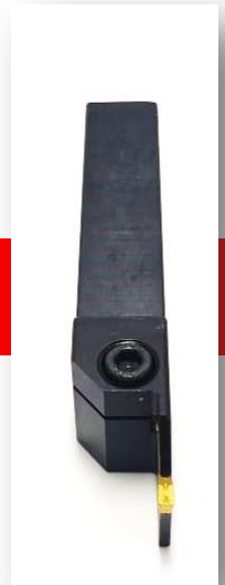
Suporte para ferramenta de sangrar