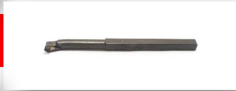
Ferramenta iso 9 10X10