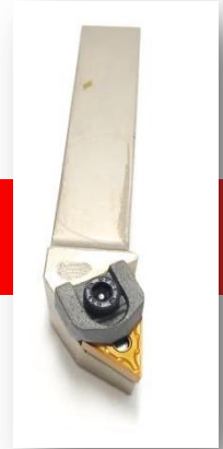
Suporte tnmg com calço