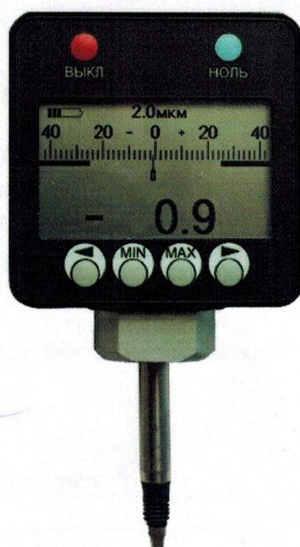
Рисунок 2 – Общий вид головок ИГЦМ

Пломбирование корпуса головок не предусмотрено.